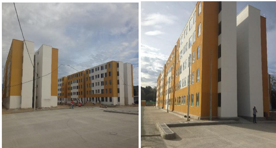
Ilustración 3. Imagen proyecto de Construcción Residencial Yuma