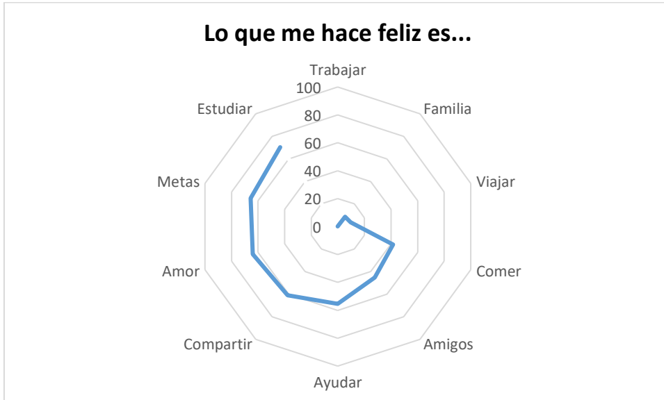
Figura 3. Definidoras y DSC en docentes de la UNAD –Zona sur para representar el estímulo “Lo que me hace feliz es...”

En la Figura 4 se muestran las definidoras utilizadas en el estímulo “La felicidad me produce...”, con un total de 112 palabras, en donde se tuvieron en cuenta 10 palabras con mayor PS. Las definidoras con mayor importancia fueron “tranquilidad” (PS=231), “alegría” (PS=201), “paz” (PS=191), “amor” (PS=142), “reír” (PS=118), “salud” (PS=103), “bienestar” (PS=65), “ánimo” (PS=64), “satisfacción” (PS=61) y “energías” (PS=44) de acuerdo con los valores del PS y DSC definidos (Tabla 1). La red semántica en relación a este estímulo quedo construida inicialmente por definidoras cognoscitivas –tranquilidad, paz, bienestar, salud, energías y satisfacción-, posterior a ello se utilizaron definidoras emocionales –alegría, amor- y definidoras de acción –reír. De igual forma las definidoras “familia” y “amigos” se ubicaron dentro de la categoría de relaciones interpersonales. Todos los referentes utilizados en la figura 4 tuvieron una carga afectiva positiva.