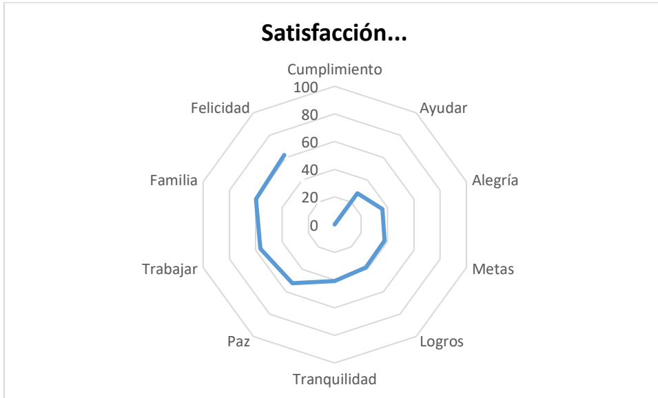
Figura 5. Definidoras y DSC en docentes de la UNAD –Zona sur para representar el estímulo distractor “Satisfacción...”

Finalmente, en la tabla 6 se exponen los indicadores estadísticos por cada estímulo. Se presenta el TR, con el cual se puede valorar la riqueza de la RS en función al número de palabras asociadas a cada estímulo. Las definidoras seleccionadas a partir del PS, la DSC y el punto de quiebre propuesto por Cattell para lograr el análisis factorial, así como los valores correspondientes en cada uno de los estímulos presentados. La organización de datos por medio de esta tabla permite hacer una comparación en torno a los PS y la DSC intra e inter estímulo.