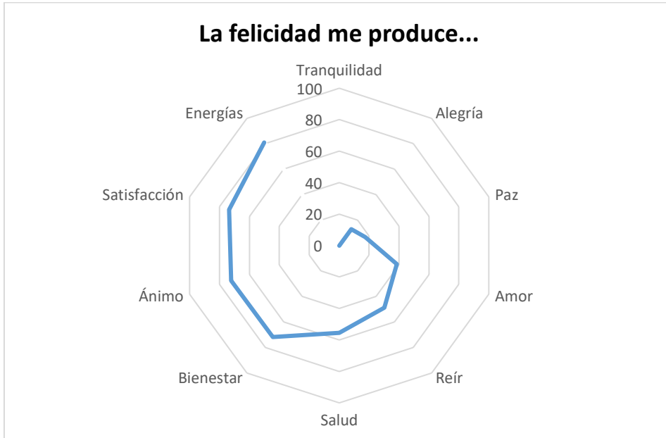
Figura 4. Definidoras y DSC en docentes de la UNAD –Zona sur para representar el estímulo “La felicidad me produce...”

Como estímulo distractor “ Satisfacción... ” se logró un total de 142 definidoras que conformaron el TR, de las cuales se utilizaron las 10 primeras con mayor PS para la construcción de la figura 5, en donde las más representativas fueron “cumplimiento” (PS=172), “ayudar” (PS=124), “alegría” (PS=110), “metas” (PS=107), “logros” (PS=106), “tranquilidad” (PS=102), “paz” (PS=82), “trabajar” (PS=75), “familia” (PS=69) y “felicidad” (PS=65). La definidora más representante de la gráfica fue “cumplimiento” siendo clasificada en la categoría de cognoscitiva, así como también las definidoras “ayudar”, “logros”, “metas”, “trabajar”, “tranquilidad”, “felicidad” y “paz” fueron incluidas dentro de esta categoría. Las definidoras de la gráfica también se clasifican en categorías de acción –trabajar-, y definidoras como “familia” en la categoría de relaciones interpersonales.