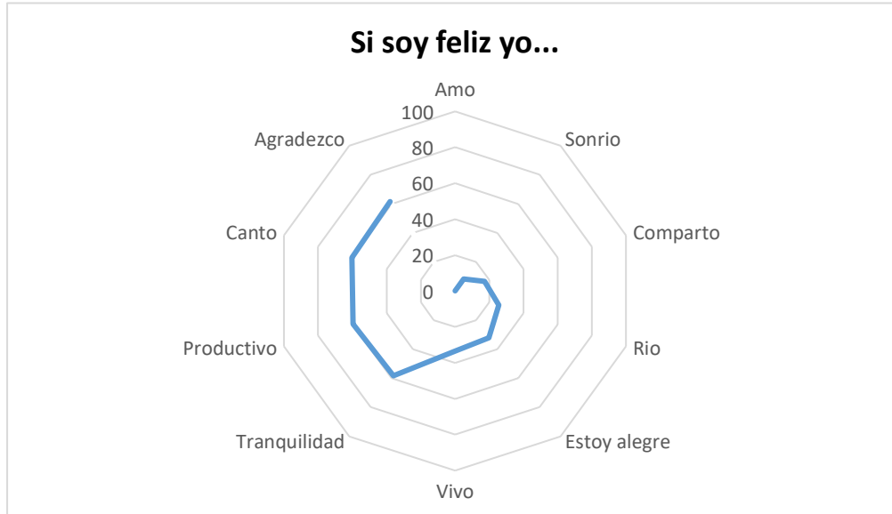
Figura 2. Definidoras y DSC en docentes de la UNAD –Zona sur para representar el estímulo “Si soy feliz yo...”

En la Figura 3 se indica las definidoras que conforman la RS del estímulo “Si soy feliz yo...”, con un total de 127 palabras utilizadas para la construcción del TR. Las palabras utilizadas para el gráfico fueron las 10 primeras permitiendo reducir la cantidad de referentes mediante los criterios de selección mencionados anteriormente. Las palabras con mayor relevancia para los docentes de la UNAD – Zona Sur fueron “trabajar” (PS=195), “familia” (PS=178), “viajar” (PS=176), “comer” (PS=114), “amigos” (PS=107), “ayudar” (PS=87), “compartir” (PS=76), “amor” (PS=70), “metas” (PS=67) y “Estudiar” (PS=58) de acuerdo con los valores del PS y DSC definidos en la Tabla 1. La red semántica en relación a este estímulo quedo construida inicialmente por definidoras relacionadas con acciones –trabajar, viajar, comer, ayudar, compartir y estudiar-, posterior a ello se utilizaron definidoras cognitivas –metas- y definidoras clasificadas dentro de la categoría de relaciones interpersonales –familia y amigos-. Todos los referentes utilizados en la figura 3 tuvieron una carga afectiva positiva.