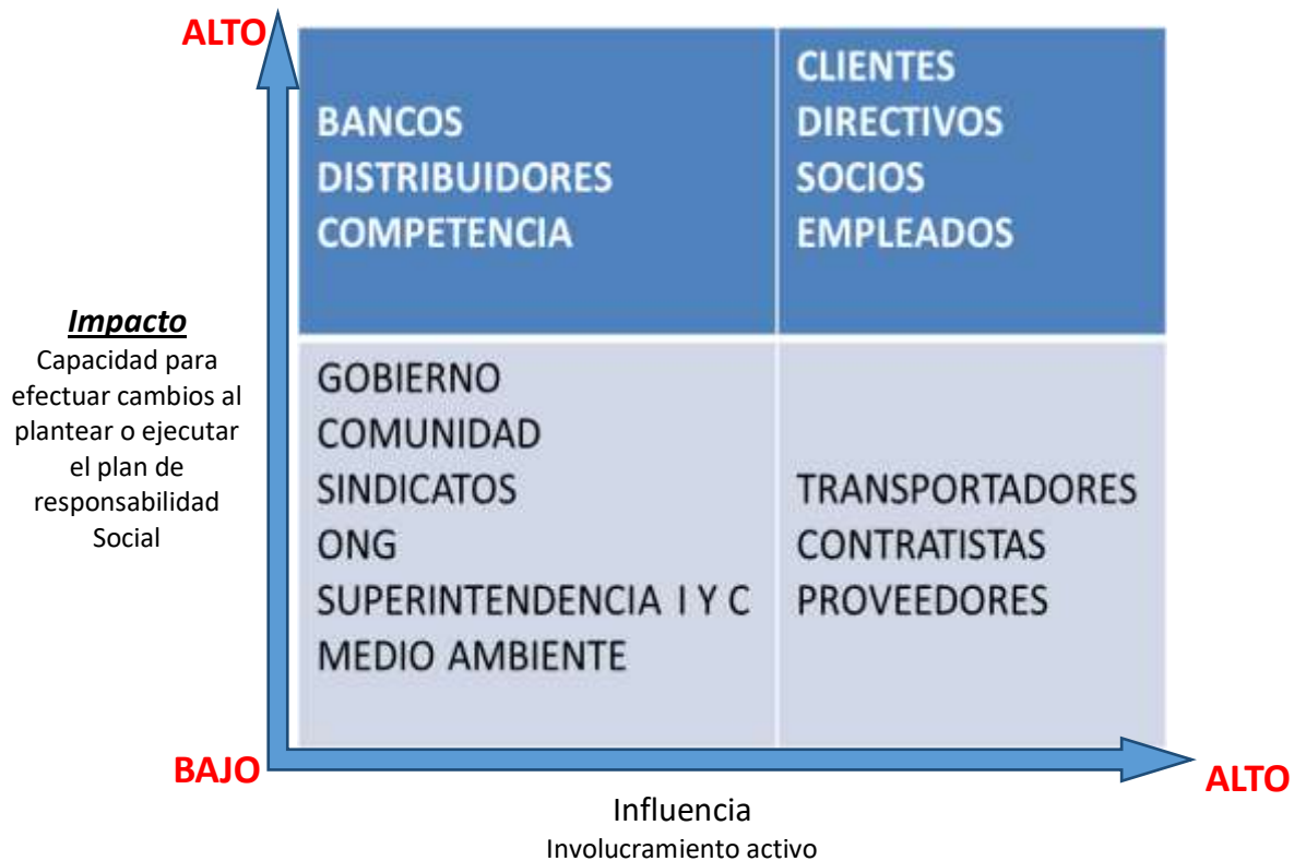
Ilustración 2 (Matriz de relaciones de influencia involucramiento activo)

La siguiente figura nos permite analizar los grados de importancia en las relaciones con los Stakeholders, con el fin de enfocar la atención prestando dedicación a los diferentes indicadores.