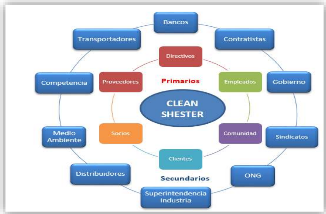
Ilustración 1 (Mapa genérico seleccionado para Clean Shester).

Para Clean Chester se definieron dos categorías fundamentales de Stakeholders.