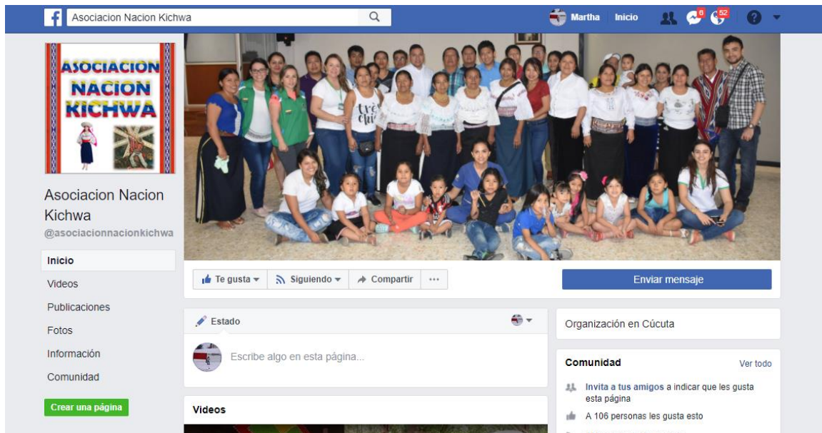
Ilustración 2. Captura de pantalla página de Facebook Asociación Nación Kichwa

Fuente 4. https://www.facebook.com/asociacionnacionkichwa/