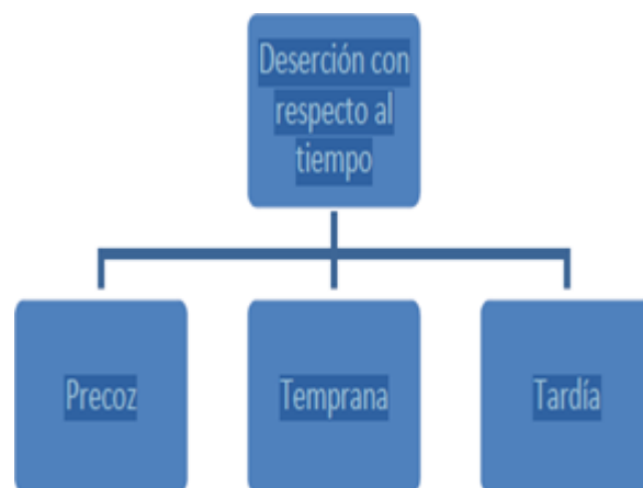
Cuadro 1. Tipos de deserción con respecto al tiempo.

El rendimiento académico es uno de los factores fundamentales en la deserción, como los mencionan Villamizar y Romero (2011). Éste puede ser determinado por otros elementos, “carácter psicosocial como: Edad, experiencias previas de aprendizaje, colegios donde estudió, género, situación socio-económica, entorno familiar, relaciones interpersonales establecidas, conformación de grupos, autopercepción de cualidades”, los cuales deben ser tenidos en cuenta a la hora de elaborar un perfil de estudiantes que se encuentran bajo riesgo de deserción (p. 43).