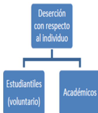
Cuadro 2. Tipos de deserción con respecto al individuo.