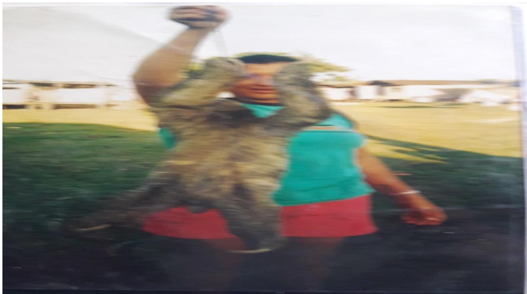
Imagen N° 1. Imagen oso perezoso

En Colombia la densidad de población está entre 0,6 a 4,5 animales por hectáreas no presentan una amenaza para la población sin embargo la deforestación que conduce a la degradación severa de su hábitat, puede presentar a corto plazo un factor de riesgo para el lugar de estrategia de este mamífero el cual en nuestro país es cazado para venderlo en los mercados públicos de la zona ribereña, sin contar algunos por parte de las entidades ecológicas, siendo este factor otro riesgo de amenaza para el perezoso llamado también perico.