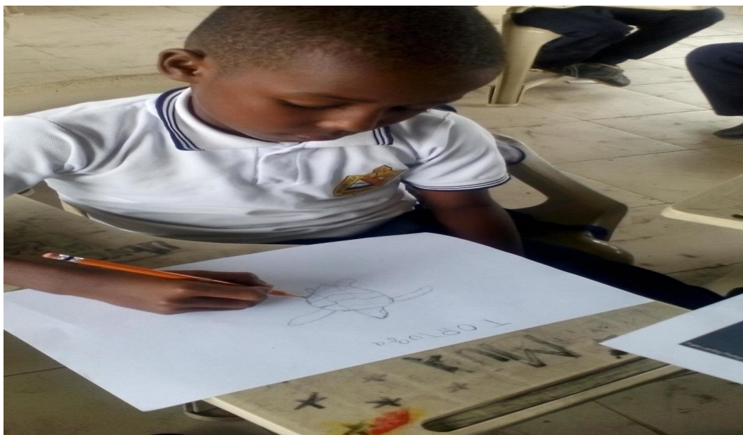
Imagen N°.5. Actividad. Dibujo animales en vía de extinción

En este momento los niños y niñas se apropian del conocimiento y las herramientas para preservar y proteger las especies en vía e extinción de la región.