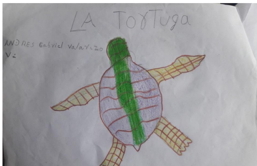
Imagen N°. 4. Tortuga dibujada por estudiantes

Presentarle la importancia de la conservación de los recursos naturales a los niños y niñas del grado segundo de la Institución Educativa Liceo del Pacifico con la presentación de videos y documentales.