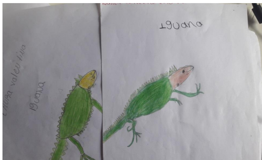
Imagen N°. 6. Iguana dibujada por los niños

Después del desarrollo de las actividades realizamos el proceso de evaluación sobre los logros obtenidos con las actividades planeadas en el marco del proyecto, esto implica conocer las actividades obtenidas con los niños hacia la preservación a las especies en vía de extinción.