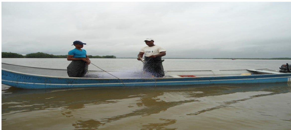
Imagen N°. 3. Actividad de pesca