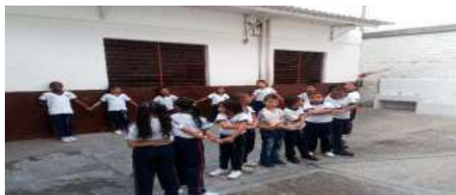
Figura 5. La figura muestra a los estudiantes participando en el juego afro del pan quemado