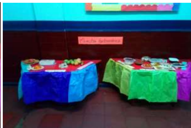
Figuras 9 y 10. Las figuras muestran los platos típicos afro traídos por los estudiantes a clase Autoría propia.