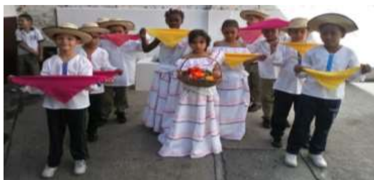
Figura 15. La figura muestra a los estudiantes con los trajes típicos en el baile afro (Bunde a San Antonio)