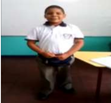
Figura 7. La figura muestra un estudiante recitando poema afro.