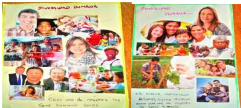
Figuras 13 y 14. La figura muestra collages sobre la diversidad humana hechos por los estudiantes.