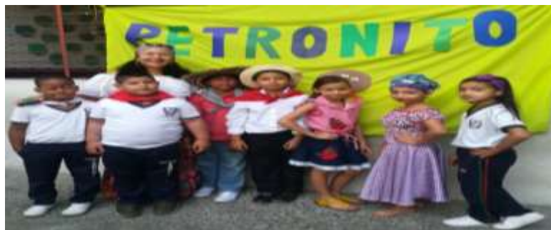
Figura 17. La figura muestra la actividad de cierre sobre el Petronito que reunió diferentes actividades vistas