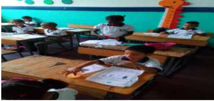
Figura 2. La figura muestra a los estudiantes realizando la actividad de lengua castellana relacionada con la historia de niña bonita