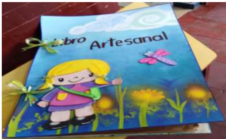
Figura 18. La figura muestra el libro artesanal compilatorio de las actividades del proyecto pedagógico.