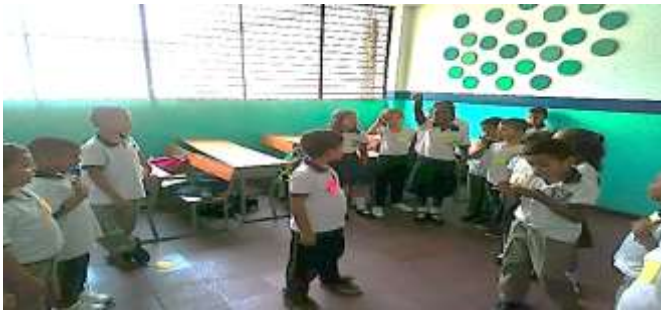
Figura 3. La figura muestra la imagen del juego de colores que permite identificar lo realizado en clase de Ética.