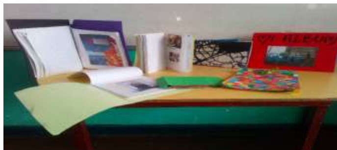
Figura 6. La figura muestra algunos álbumes sobre las costumbres afro creados por los estudiantes.