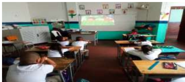
Figura 4. La figura muestra a los estudiantes observando un video de Guillermina y Candelario