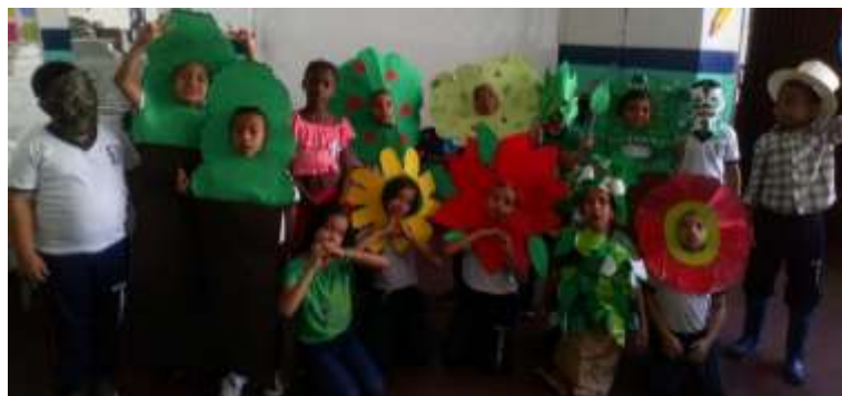
Figura 8. La figura muestra a los estudiantes con sus trajes para la presentación de la obra de teatro de la semillita