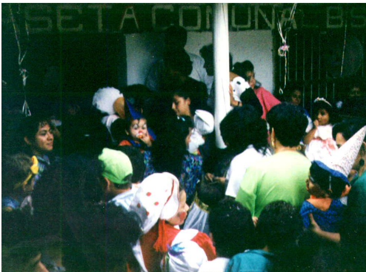
Momentos en que los niños departían alegremente de su día en acto que tubo fin en los recintos de la caseta comunal.