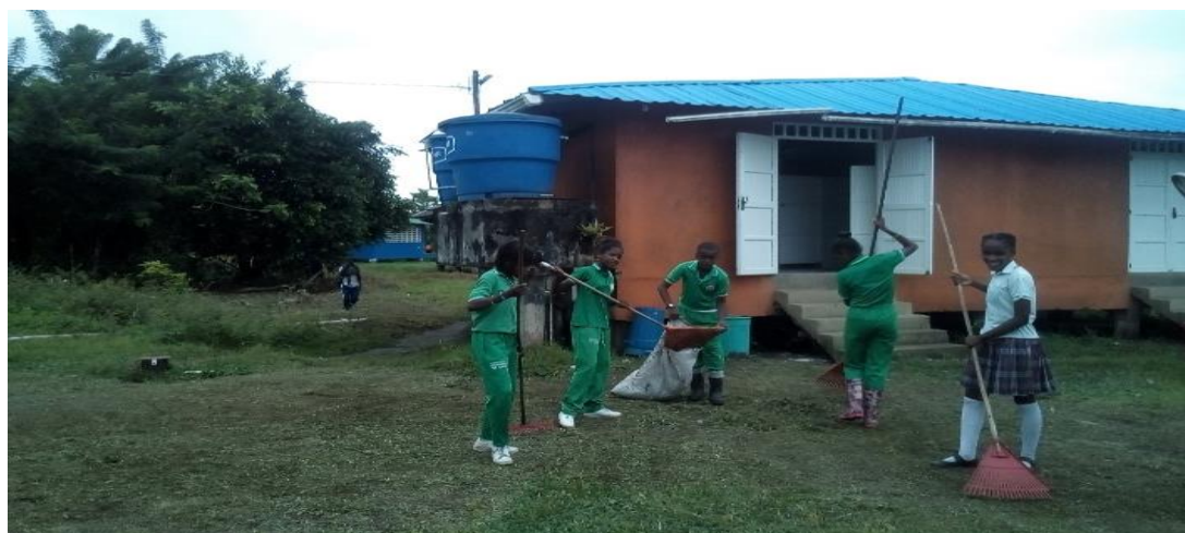
Figura 9: Minga con los estudiantes del grado 8°

Es un poco duro, pero no imposible porque al menos ahora se empezó a generar conciencia de los daños que se causan al medio ambiente y sobre cuál será la consecuencia en un futuro no muy lejano