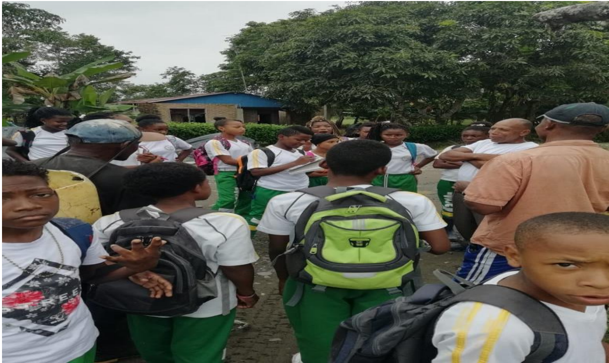
Figura 8: estudiantes del grado 8°

lleva los conocimientos teóricos y en base al tema medio ambiente características y elementos se desarrollan conocimientos teóricos