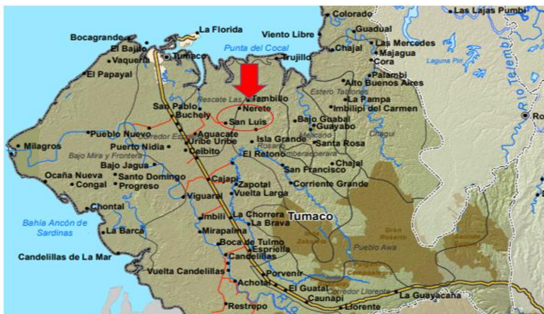
Figura 3: vereda San Luis Robles en el Municipio de Tumaco

Los estudiantes en su totalidad son de la vereda robles y las veredas vecinas, provienen de familias de agricultores y de familias que derivan su sustento de la agricultura, la ganadería en menor escala y la pezca, así como la siembra de palma de aceite o de cultivo de camarón.