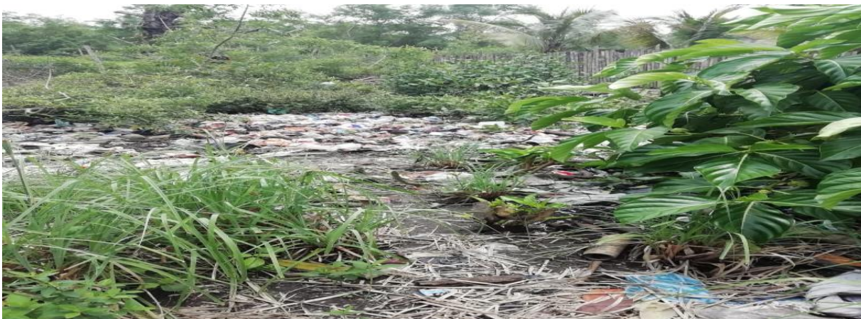
Figura 5: Manejo inadecuado de los residuos en la Institución Educativa San Luis Robles