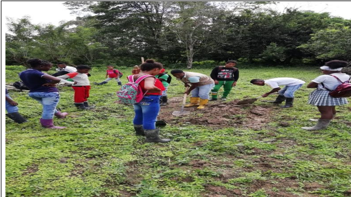
Figura 7: Minga con los estudiantes del grado 8°