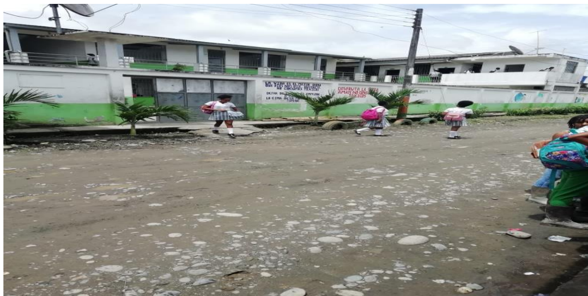
Figura 4: Institución Educativa San Luis Robles