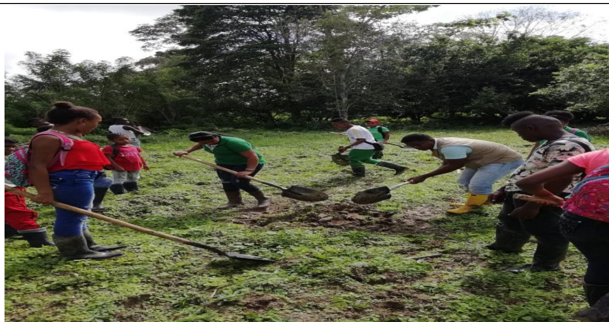
Figura 6: Minga con los estudiantes del grado 8°

TEMA: la minga y la conservación del medio ambiente.