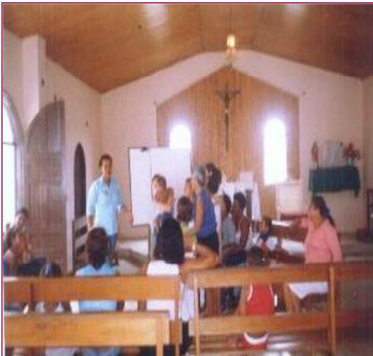
Foto 3. Dinámica de integración