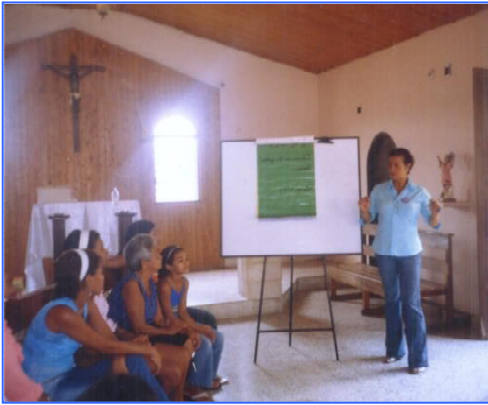
Foto 1. Taller . Autoconcepto