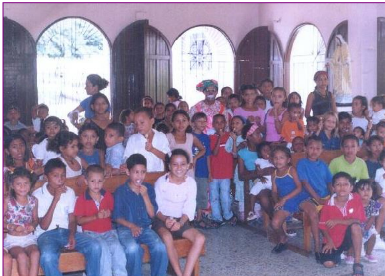
Foto 4. Taller Generando autoestima en los niños