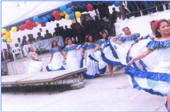
Foto 5. Clausura del Taller Navegando en valores