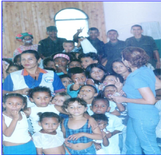
Foto 3. Niños posando para la foto.