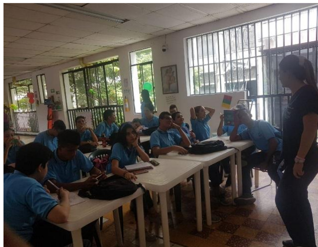
Figura 4. Registro Fotográfico Talleres de Aplicación

Talleres de Aplicación para Estudiantes de 8vo. Grado de la IE INEM, Neiva (H).