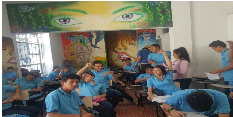
Figura 3. Registro Fotográfico de las Jornadas de Sensibilización

Jornadas de Sensibilización a Estudiantes de 8vo. Grado de la IE INEM, Neiva (H).