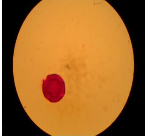
Imagen de polen. 100X. C. arabica . Extraído del pan de abejas. (Penagos, A. 2016)