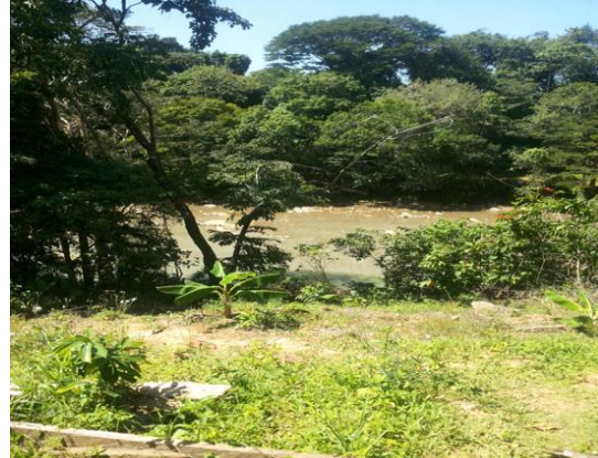
Fotografía 3: Cultivos sobre la ronda protectora de la microcuenca Rio Chiquito

Fuente: Cultivos sobre la ronda protectora/Carlos Hernández. vereda rio chiquito. Municipio de Aguazul.