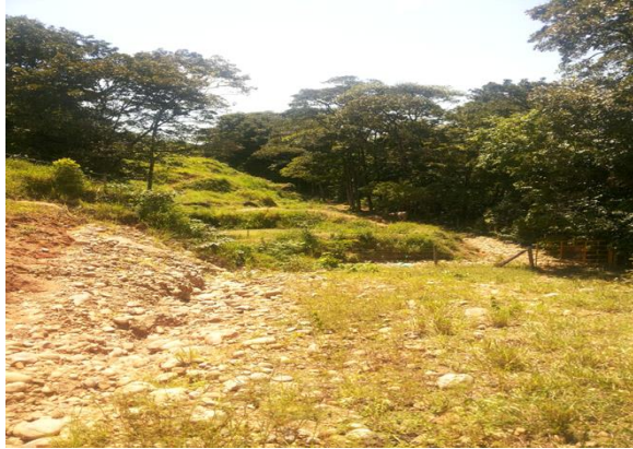
Fotografía 2: Zona Deforestada

Fuente: Zona deforestada/Carlos Hernández. vereda rio chiquito. Municipio de Aguazul.