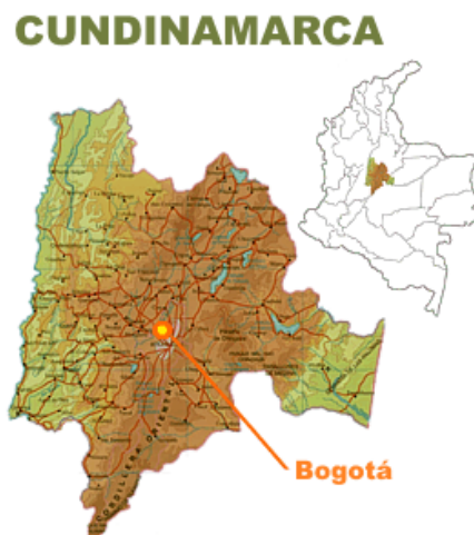
Fig. 12. Mapa de Cundinamarca

Los Parques Rurales de Cundinamarca son administrados por la Corporación Autónoma Regional de Cundinamarca, CAR. Entre ellos tenemos: