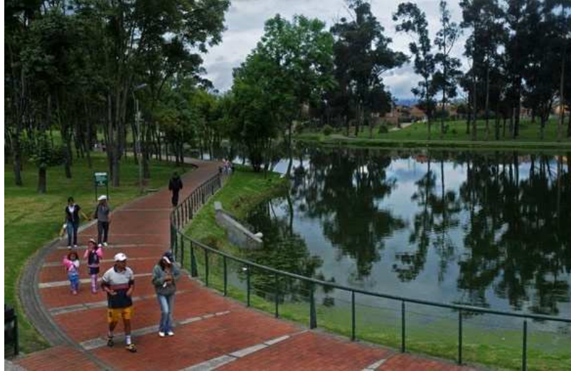
Fig. 9. Parque Timiza, Bogotá D.C. (2011)

Indudablemente, “uno de los problemas más importantes que una ciudad debe afrontar en las próximas décadas, es la escasez de suelo para urbanizar” (Enunciado de Robert Malthus, Economista-Político y Demógrafo, cuyas afirmaciones de más de 200 años hoy tienen mucha relevancia). Esto debido a su crecimiento, ya que éste se dobla cada 25 años siguiendo a una progresión geométrica, pero el suelo y los recursos por el contrario no aumentan.