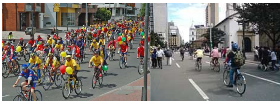
Fig. 6 y 7. Ciclo-vía en Bogotá D.C. (2011)

El circuito del norte, por su parte tomaba la calle 26 hasta la carrera 7, la carrera 7 de la calle 26 a la calle 116 y la calle 116, hasta la avenida Boyacá, que finalizaba al norte en la calle 127 y al sur en el parque El Tunal. Adicionalmente la carrera 30 desde la Autopista sur hasta la calle 26 y la carrera 50 desde la Autopista Sur hasta la Avenida Américas. Aclarando que el circuito conectó los puntos de Recreo vía ya existentes.