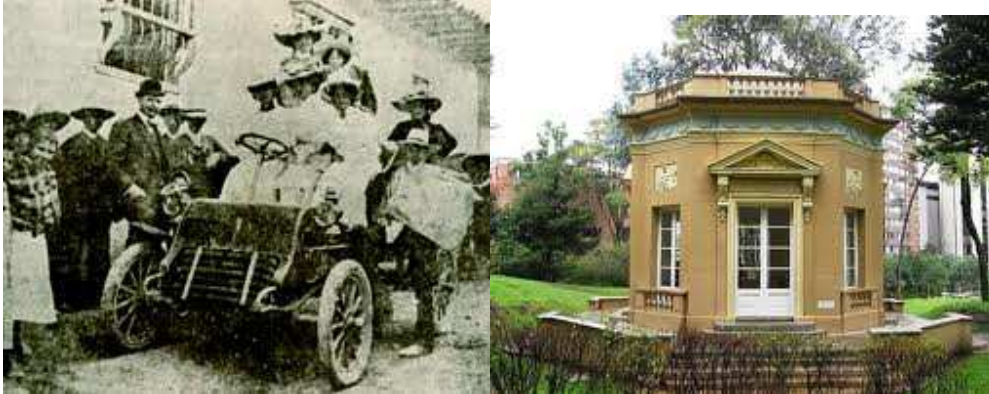
Fig. 3 y 4. Primer vehículo mecánico en Bogotá - Parque de la Independencia, Primer Parque de Bogotá

Hoy la Ciudad de Bogotá D.C. del siglo XXI se ve avocada a tener grandes consideraciones a algo tan vital como es el Espacio Público. El análisis de la situación del Espacio Público implica hacer referencia a los estudios adelantados para la consolidación del PLAN MAESTRO DEL ESPACIO PÚBLICO, adoptado mediante el Decreto Distrital 215 de 2005, cuyo Documento Técnico de Soporte trata, entre otros aspectos, la apropiación del Espacio Público desde la gestión de las entidades y organizaciones civiles, así como, a las formas de ocupación y uso del espacio público con fines de aprovechamiento y apropiación agregados, en donde en este último se plantea: