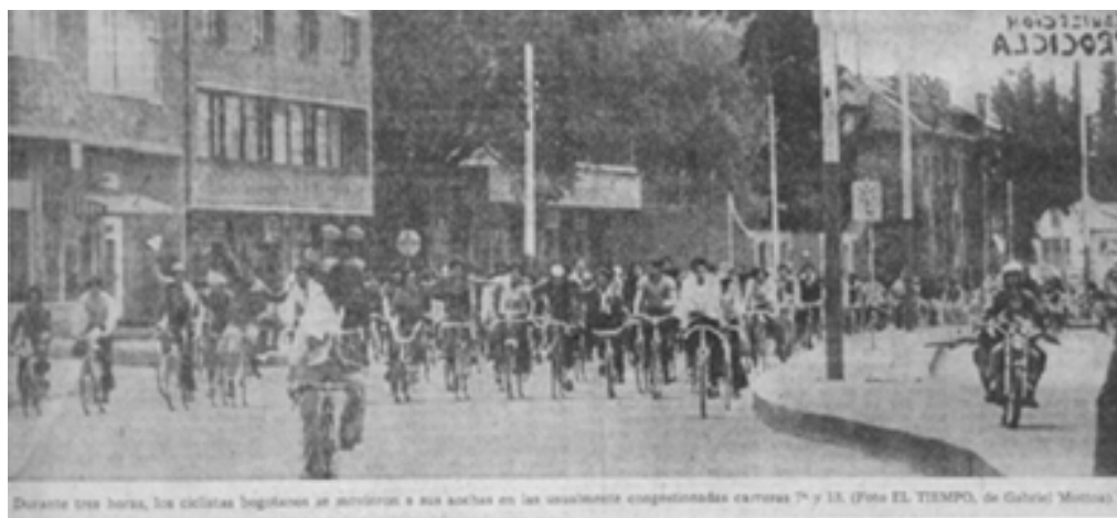
Fig. 5. Primera ciclo-vía organizada en Bogotá en 1974

Al evento asistieron más 5000 Bogotanos, quienes salieron a manifestar en contra de la proliferación de automóviles, la contaminación ambiental y la falta de oferta recreativa en la ciudad.