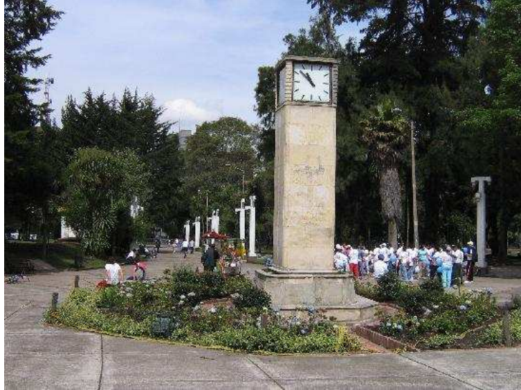
Fig. 11. La Torre del Reloj – Parque Nacional Enrique Olaya Herrera, Bogotá

Fue donado por la comunidad suiza residente en Colombia, hacia 1954. De aquí se despliega un pintoresco sendero peatonal con bancas y faroles que atraviesan el parque hasta llegar a la carrera 7ª. (7).