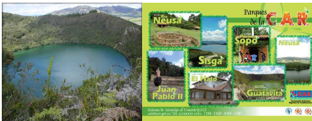
Fig. 13 y 14. Laguna de Guatavita y Cuadro con los Parques de la CAR

Como atracciones para destacar en estos parques rurales de tiene una Estación Piscícola, en el Parque Forestal Embalse El Neusa, donde sus visitantes pueden ver el proceso productivo de la trucha, ejemplares que se pueden comprar y disfrutar. Es un sitio pedagógico donde los colegios son bienvenidos, universidades y demás instituciones interesadas.