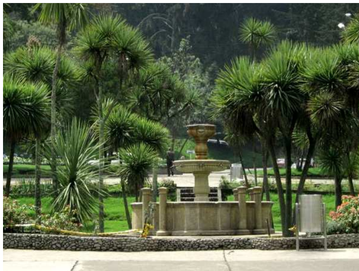
Fig. 10. La Fuente – Parque Nacional Enrique Olaya Herrera, Bogotá

El Parque Nacional Enrique Olaya Herrera, También llamado “Pulmón de Bogotá”, fue inaugurado en 1934 y es el segundo más antiguo de la ciudad. Sus 283 hectáreas traen consigo una gran diversidad de actividades.