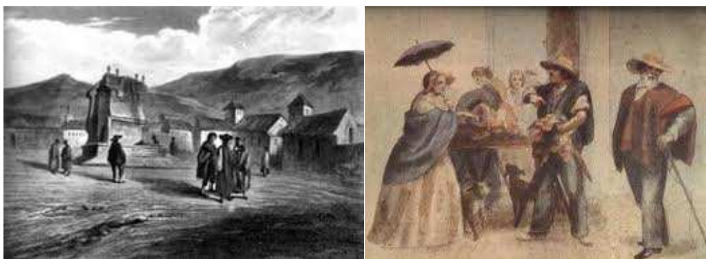
Fig. 1 y 2. Grabado del Siglo XVIII Las Pilas Santafé de Bogotá y Expendio de carne en la calle en Bogotá

Durante la Colonia, con la llegada de los españoles la situación cambia al igual que las estructuras políticas, administrativas, religiosas y económicas. Las catedrales, los monasterios y los edificios administrativos remplazaron las plazas ceremoniales (1) y se referencia la plaza principal donde desde ella se desprende para la incorporación de predios privados y de las nuevas viviendas influenciadas por la cultura española. Al indagar sobre los lugares que existieron durante la colonia según su función, se pudo observar que la mayor parte de los lugares públicos mencionados o representativos vinculados a acontecimientos de diversa índole por las fuentes consultadas son: las iglesias, algunas calles, las plazas de mercado, los ríos San Francisco y San Agustín, algunas fuentes de agua (1).