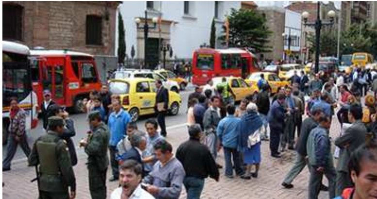
Fig. 8. Bogotá D. C., Carrera 7ª. (2011)

sociales le imprime cada uno de quienes habitan la ciudad, ya sea de manera permanente o transitoria.