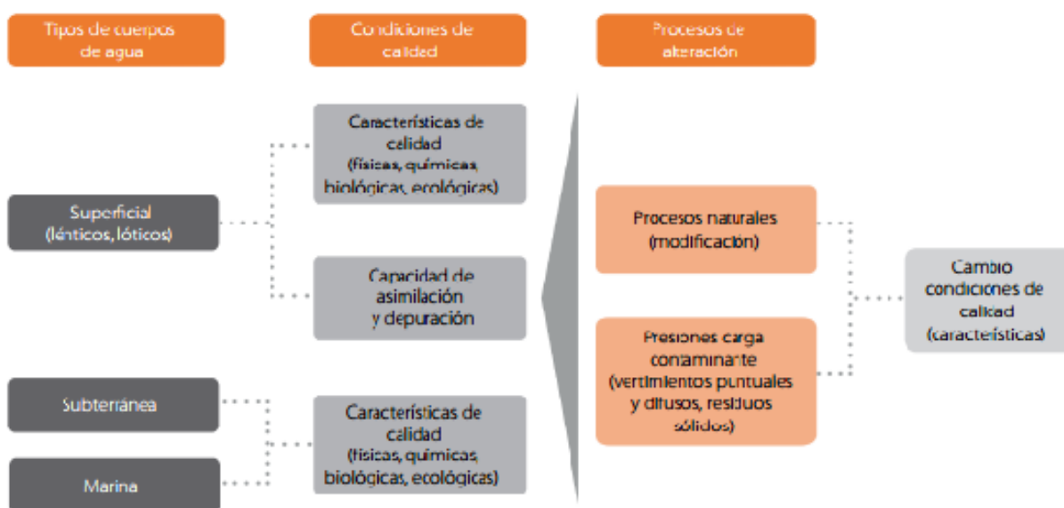
Figura 2. Características de calidad de agua.