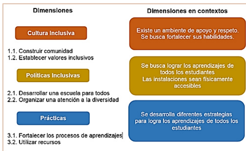
Diagrama 6. Modelo para fortalecer la educación inclusiva

Garantizar una educación inclusiva y equitativa de calidad promoviendo oportunidades de aprendizaje permanente para todos... al eliminar las disparidades de género en la educación, garantizado el acceso a las personas vulnerables y asegurado la inclusión de las personas con discapacidad. (p.14)