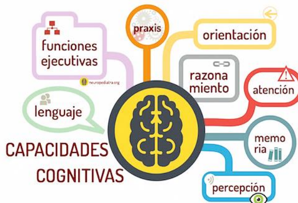
Diagrama 3. Neurodesarrollo: Capacidades Cognitivas