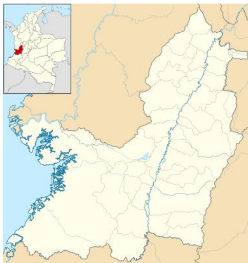
Ilustración 3. Mapa del Valle del Cauca

Ley de Infancia y Adolescencia, definiendo el grupo poblacional de los niños, niñas y adolescentes al conformarse de cero a 17 años., entendiendo que la primera infancia comprende la franja poblacional que va de los cero a los seis años, niño o niña las personas entre los 0 y los 12 años, y por adolescente las personas entre 12 y 17 años. (párr.1)