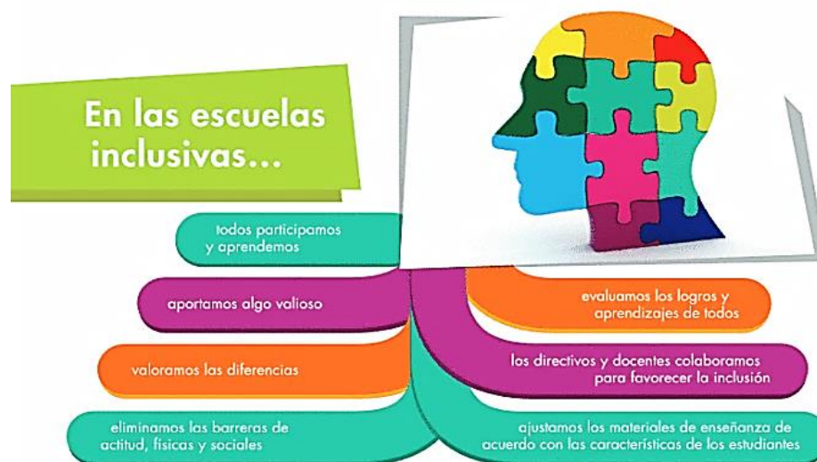
Diagrama 4. Aprendizajes Clave para la Educación Integral

La relación de los contenidos de los currículos escolares referente a los grupos de estudiantes que dispongan, valorando los intereses y las virtudes, así como los requisitos de cada alumno. Otorgándoles de una autonomía creativa, sin bloqueos creativos, en un entorno seguro para manifestar cualquier idea o emoción sin temor al ridículo, en contraposición del alumnado donde prevalece el modelo estándar de ejecución, dado que no son capaces de innovar o crear fuera de la norma. (Arias, Llamazares y Melcón, 2016, p.8)