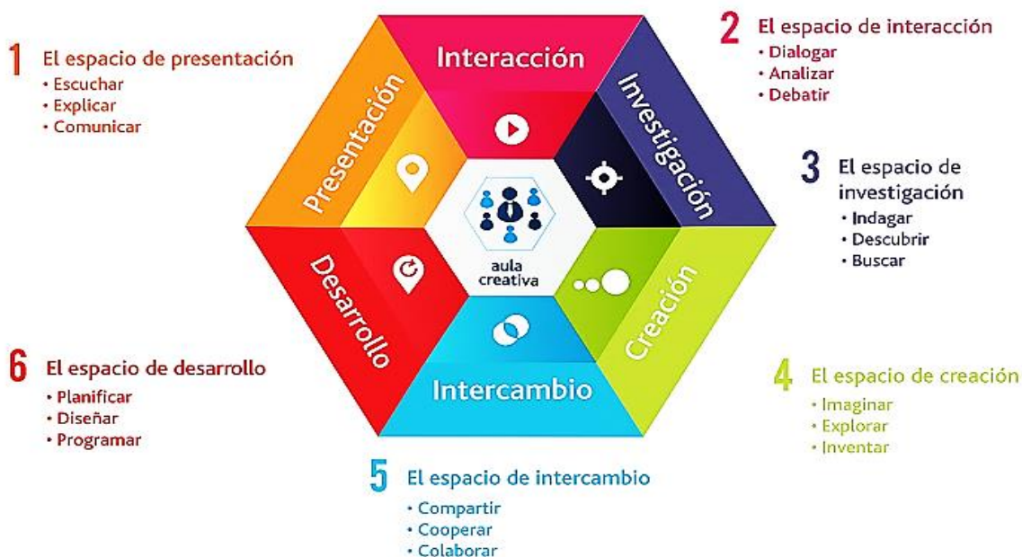
Diagrama 2. Las Aulas del Siglo XXI: Los Nuevos Escenarios del Aula Creativa

Buscar estrategias para responder a la diversidad, lo cual puede propiciar la pertenencia y la participación de los sujetos en cada una de las instituciones y de esta manera lograr la equidad social, reconociendo las necesidades y generando programas que permitan el desempeño exitoso de los estudiantes y luego su inserción exitosa en lo social y laboral. (Acevedo, 2013, p.3)