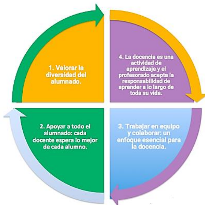
Diagrama 1. Sistema Educativo Incluyente

la igualdad nace a partir de la diversidad, incluyendo quienes son atípicos al tema; logrando que todos los alumnos puedan aprender juntos independientemente de su condición física o mental.