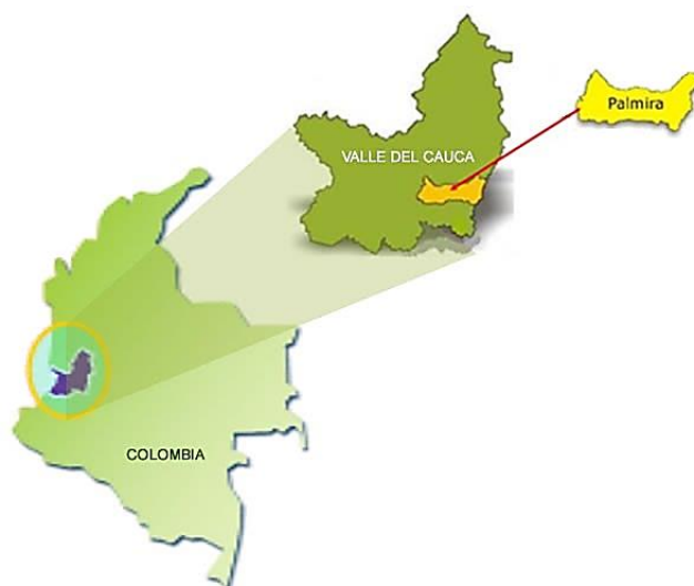
Ilustración 4. Mapa de Ubicación de Palmira Valle

Para el proceso de investigación, la muestra es un subgrupo de la población de interés sobre el cual se recolectarán datos, y que tiene que definirse y delimitarse de antemano con recisión, además de que debe ser representativo de la población. (p.176)