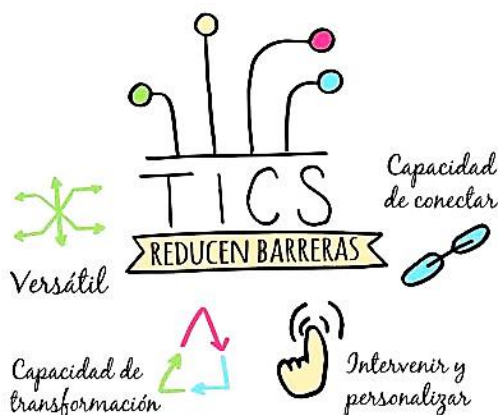
Diagrama 5. Las TICs son exitosas para reducir las barreras

Al hablar de inclusión educativa debemos hacer mención de la inclusión tecnológica y es que, a la hora de adaptar los programas a las necesidades del alumnado, las TIC ofrecen un gran abanico de posibilidades y facilitan que el profesorado sea capaz de crear ambientes propicios de aprendizaje para todo el alumnado. Para lograr uso adecuado de las TIC e inclusión de la diversidad en las aulas y el proceso educativo. (p.76)