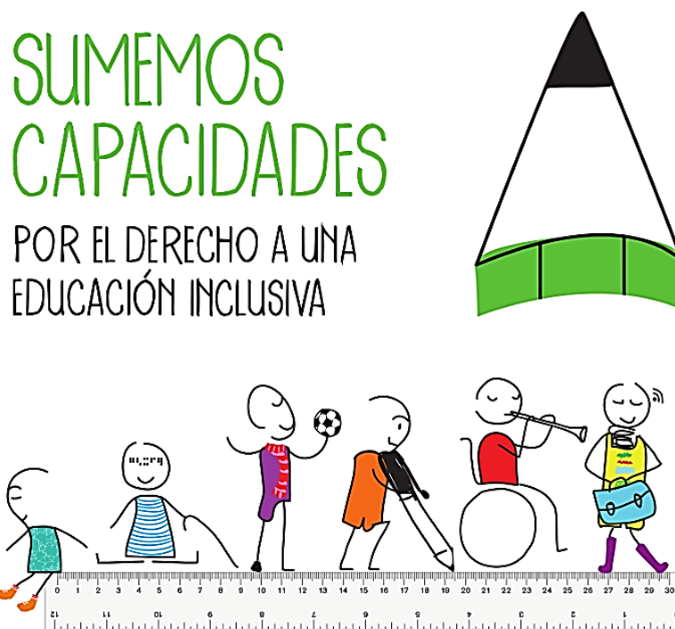
Ilustración 2. Derecho a una educación inclusiva de los niños y niñas con discapacidad

Establecimiento de acciones, adaptaciones, estrategias, apoyos, recursos o modificaciones necesarias en el sistema educativo y la gestión escolar, basadas en necesidades específicas de cada estudiante, [...], y que se ponen en marcha tras una rigurosa evaluación de las características del estudiante con discapacidad. A través de estas se garantiza que estos estudiantes puedan desenvolverse con la máxima autonomía en los entornos en los que se encuentran, y así poder garantizar su desarrollo, aprendizaje y participación. (p. 4)