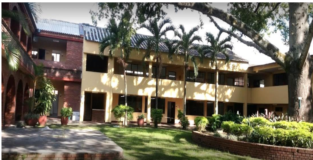
Fotografía 2. Escuela Municipal de Arte Ricardo Nieto

Dada que la población de Palmira es amplia, se especifica que el análisis de la situación de educación inclusiva se focaliza específicamente en los niños y adolescentes en condición de discapacidad que pertenecen a la Escuela Municipal de Arte Ricardo Nieto, atendiendo a personas con condición especial en aspectos como: Movilidad reducida, limitación visual, limitación auditiva, limitación expresiva/habla y limitación cognitiva para un total de 118 personas con diversidad funcional, 73% es de zona urbana y 27% de zona rural .