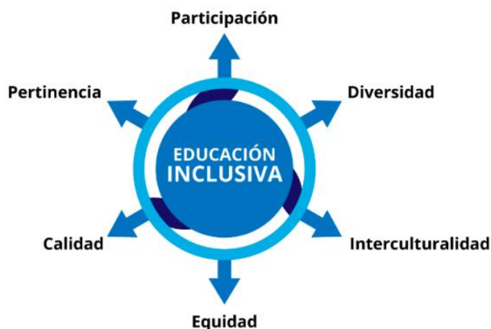
Diagrama 7. Enfoques de la Educación inclusiva

Desde un espacio intercultural, reconstruyendo el sentido educativo dentro del ciclo vital de lo comunitario y social, donde la voz propia del estudiante es valorada, en medio de la clase dada la renovación de la educación ordinaria a una transformadora y diversa; donde el alma del aula está condicionada con las vivencias de cada estudiante; al incorporarse bajo las diferentes estrategias interdisciplinarias que van desde lo lúdico-expresivo de la inclusión. Por eso, a continuación, se definen siete criterios que se aplican a la presente investigación, tales conceptos se toman como referencia del siguiente esquema de ideas entre los cuales están: