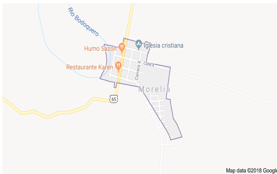
Mapa político de Morelia.