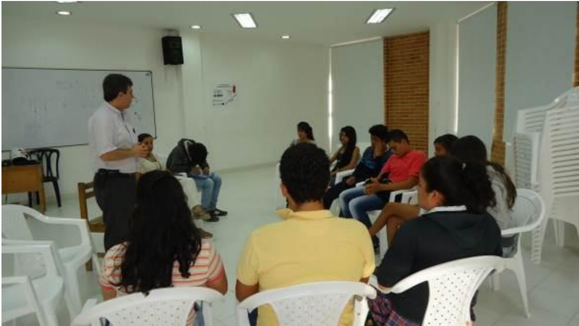
Diseño de material alusivo a los temas del proyecto educación sexual.