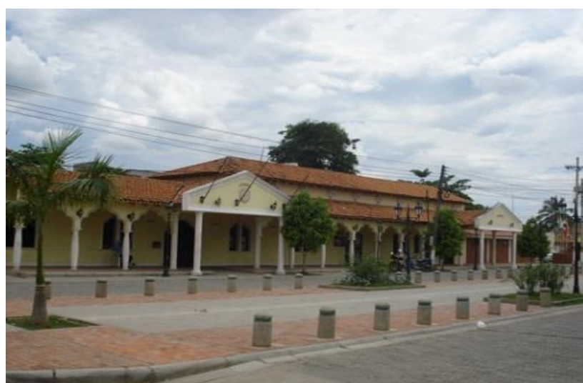
Figura 2: Alcaldía del municipio de Ricaurte- Cundinamarca.

La administración municipal cuenta con una plataforma estratégica actualizada y constituida de acuerdo al plan de desarrollo Municipal RICAURTE, NUESTRO COMPROMISO 2.016.- 2.019 estructurada de la siguiente forma.