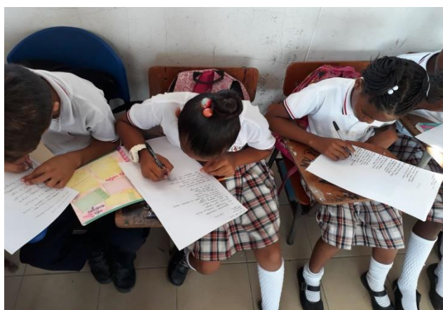
Figura 6. Estudiantes en actividades de lectoescritura a través del estudio de la decima