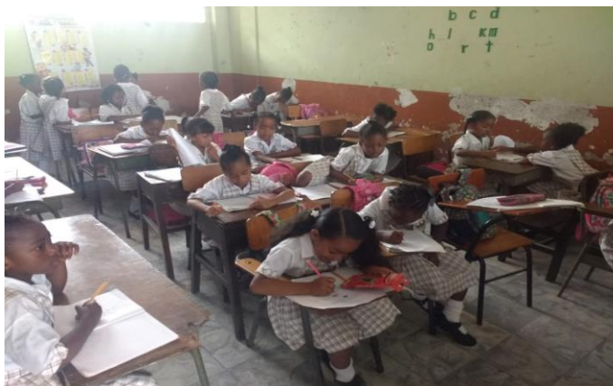
Figura 1. Estudiantes realizando ejercicio de lectoescritura y resaltando los nombres propios encontrados en la lectura.