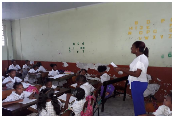
Figura 4. Docente explicando a través de ejemplos, la actividad de recitación de una decima