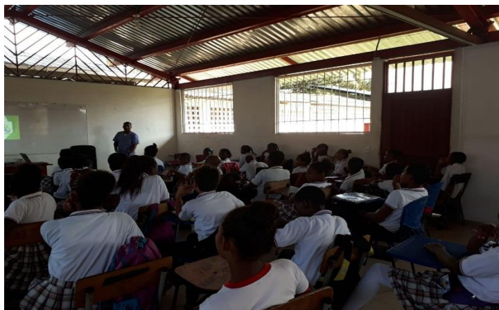
Figura 5. Sabedor del Municipio (Decimero invitado al aula de clases del grado 2°)