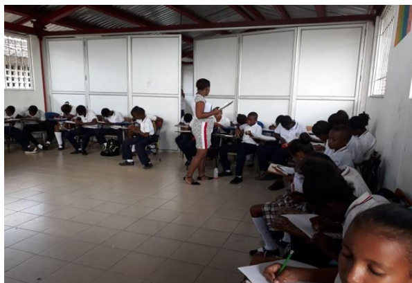
Figura 2. Docente desarrollando ejercicios de lectoescritura en estrategia pedagógica