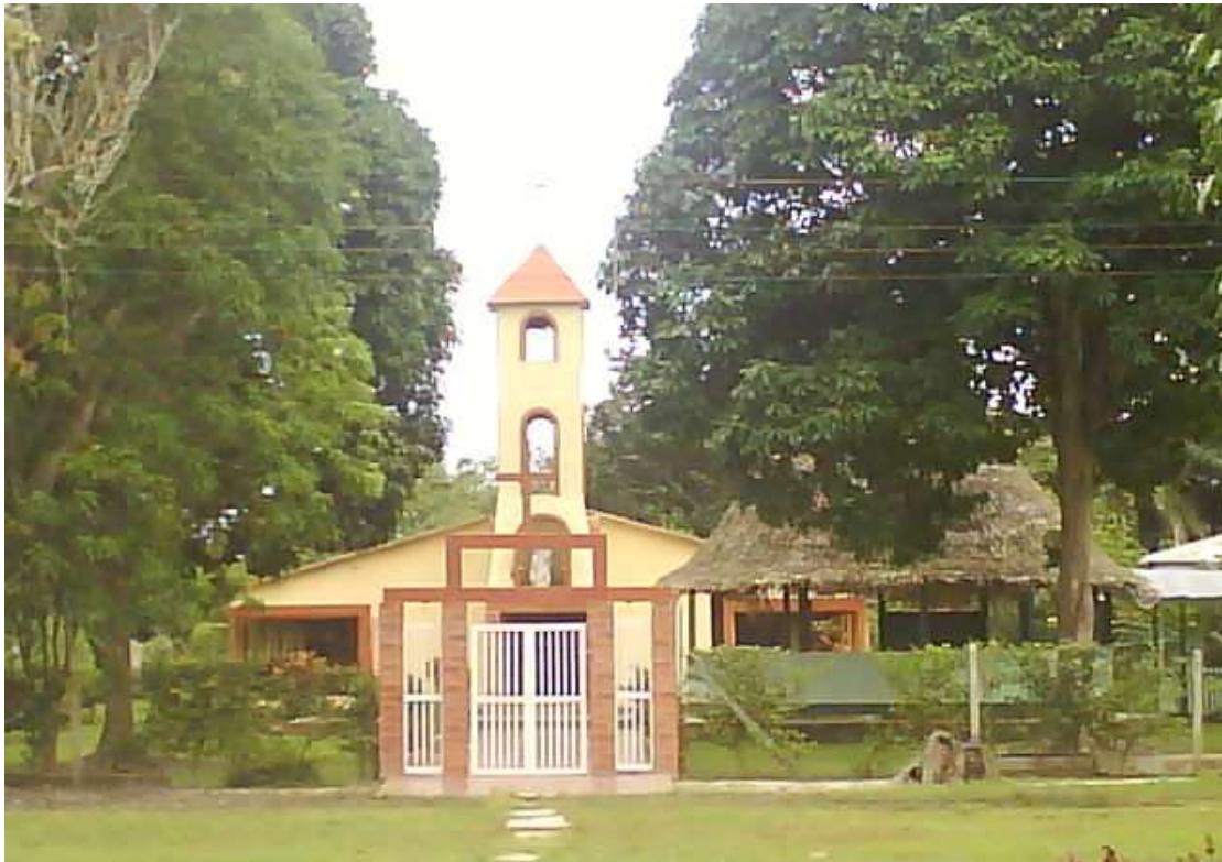
Iglesia católica Barrancominas