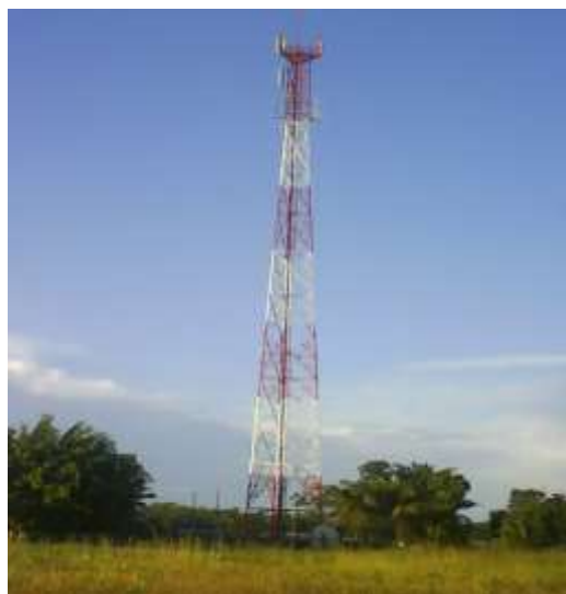
Antena Comcel (Claro)