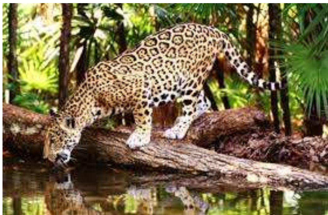
rivera rio Guaviare 2015