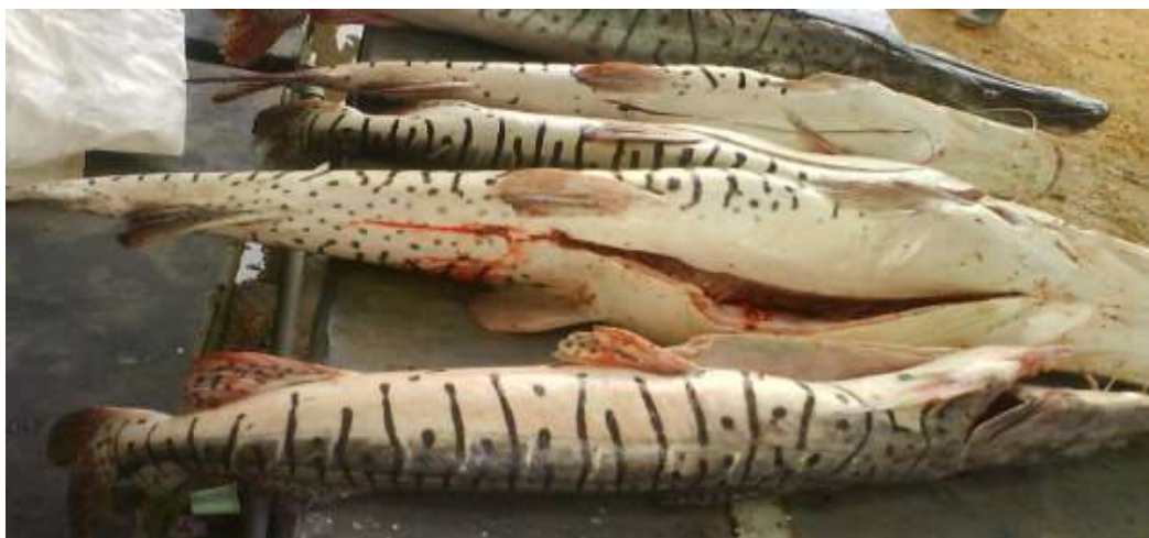
enero 2019