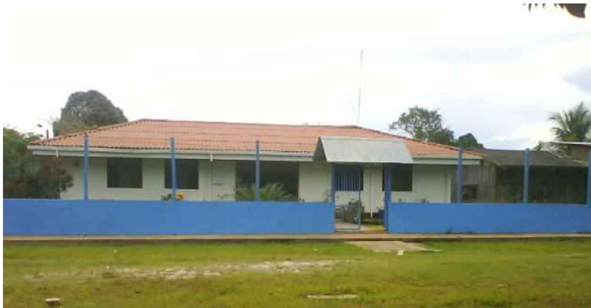
Fotografía Álbum Oscar González