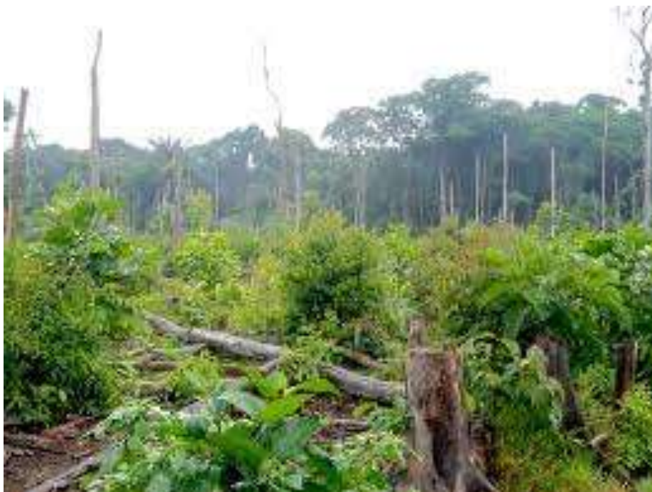
rivera rio Guaviare 2015