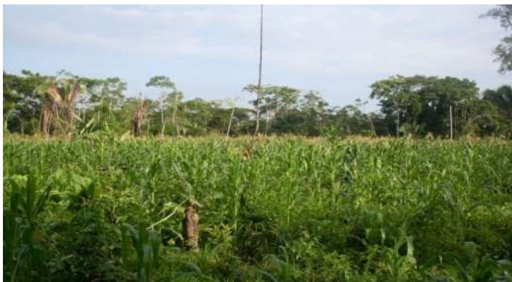
Fotografía foto: Oscar González febrero 2019