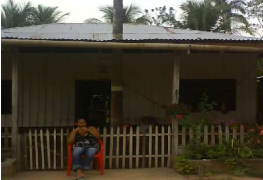
Fotografía propia casa de mi madre Barrancominas enero 2019