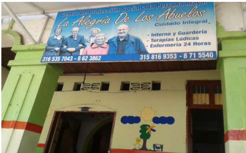
Lugar: Hogar Geriátrico la alegría de los abuelos. Motivo: Reconocimiento del hogar Fecha: 04/03/2014