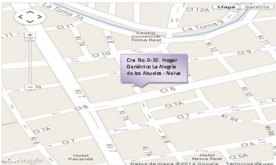
Gráfica 1. Mapa de ubicación del Hogar del abuelo feliz, Neiva

Se trabajó en el Hogar del Abuelo Feliz de la ciudad de Neiva, ubicado en la dirección Carrera 8 # 8-30 Centro, Teléfono: 871 5540 (Ver Gráfica 2)