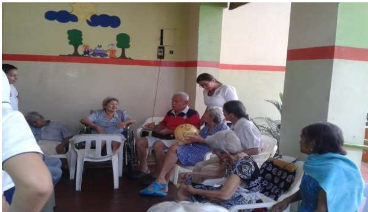
Lugar: Hogar Geriatrico la Alegría de los Abuelos Motivo: Lúdica de presentación Fecha: 07/03/ 2014