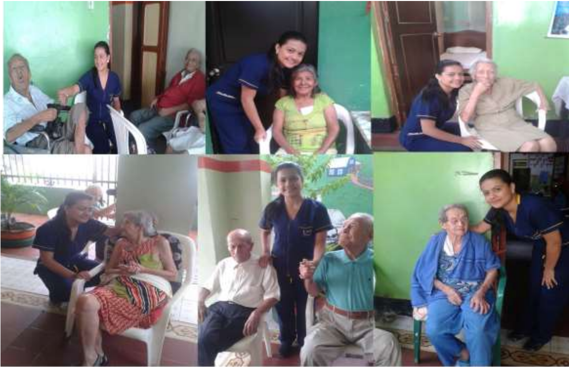
Lugar: Hogar Geriatrico la Alegría de los Abuelos. Motivo: Aplicación de entrevista semi estructurada a los adultos mayores. Fecha: 13/ 03 / 2014