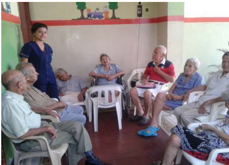
Lugar: Hogar Geriátrico la Alegría de los Abuelos. Motivo: Lúdica de presentación Fecha: 07/03/2014