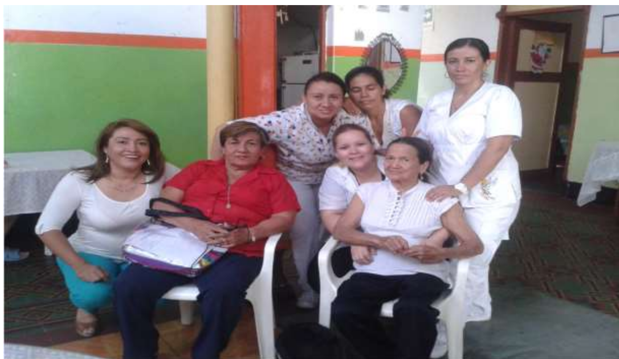
Lugar: Hogar Geriatrico la Alegría de los Abuelos. Motivo: Aplicación de entrevista semi estructurada a funcionarios. Fecha: 11/03/2014