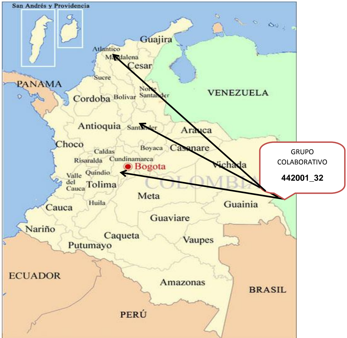
Figura 1 . Ubicación geografica estudiantes

DEPARTAMENTOS: Atlántico, Santander, Bogotá D.C.