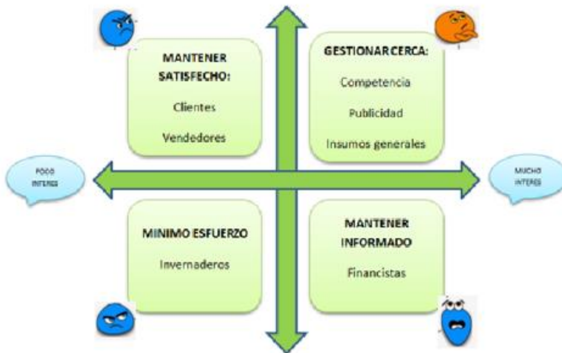
Ilustración 4. Stakeholders Diana Carolina Vargas