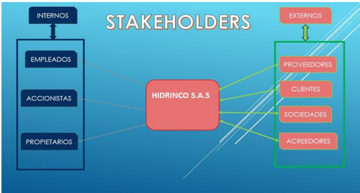
Ilustración 5. Stakeholders Javier Velásquez