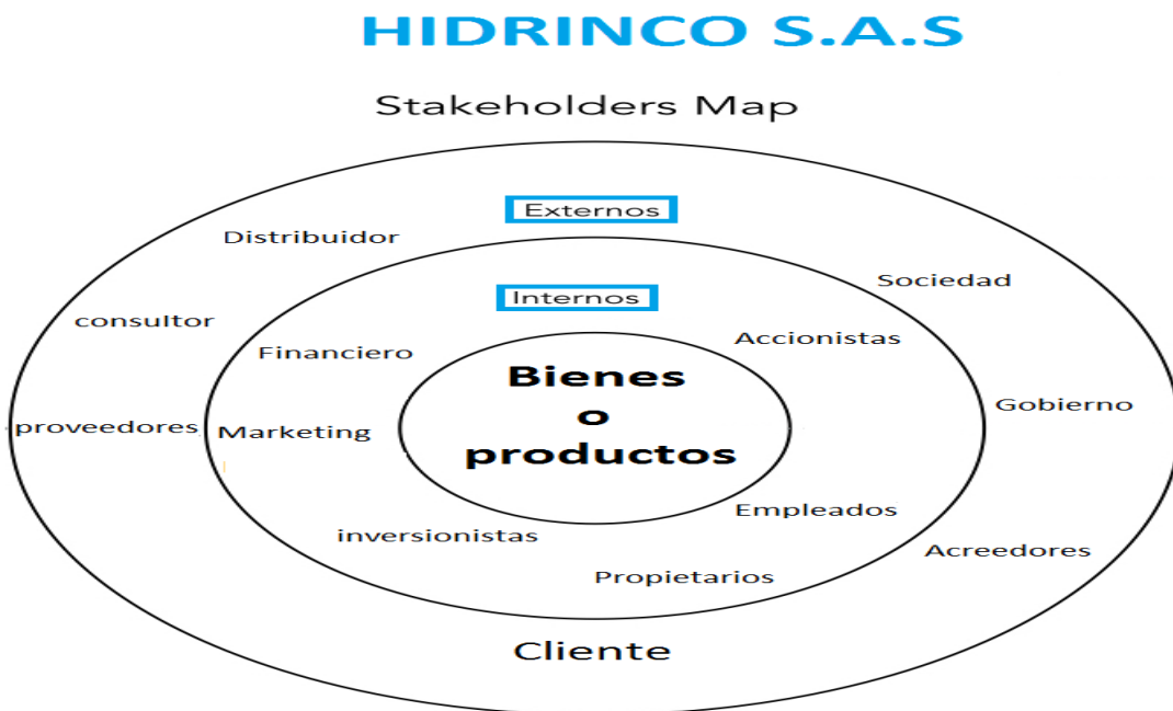
Ilustración 2. Stakeholders Gustavo López