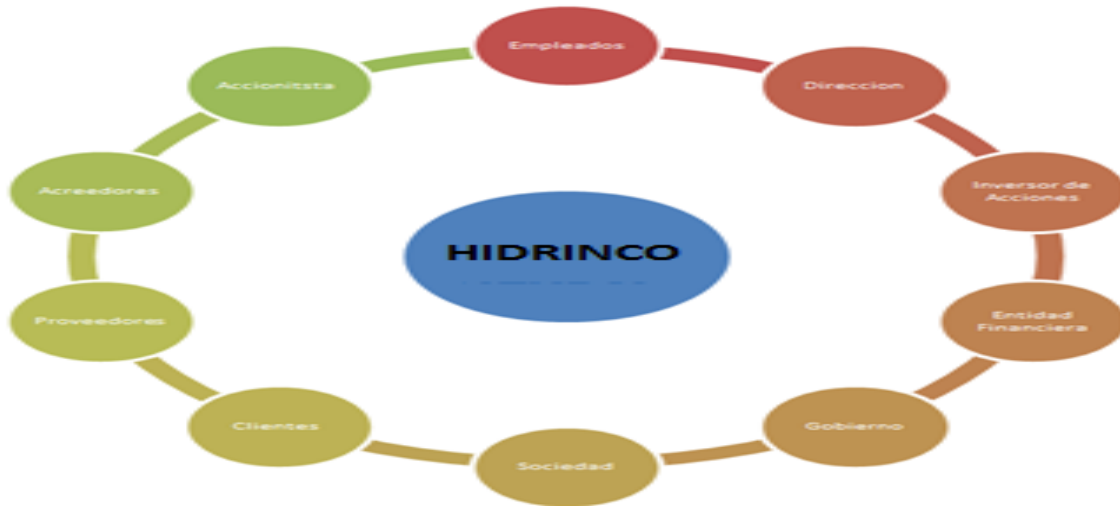
Ilustración 1. Stakeholders Jaime Sanchez