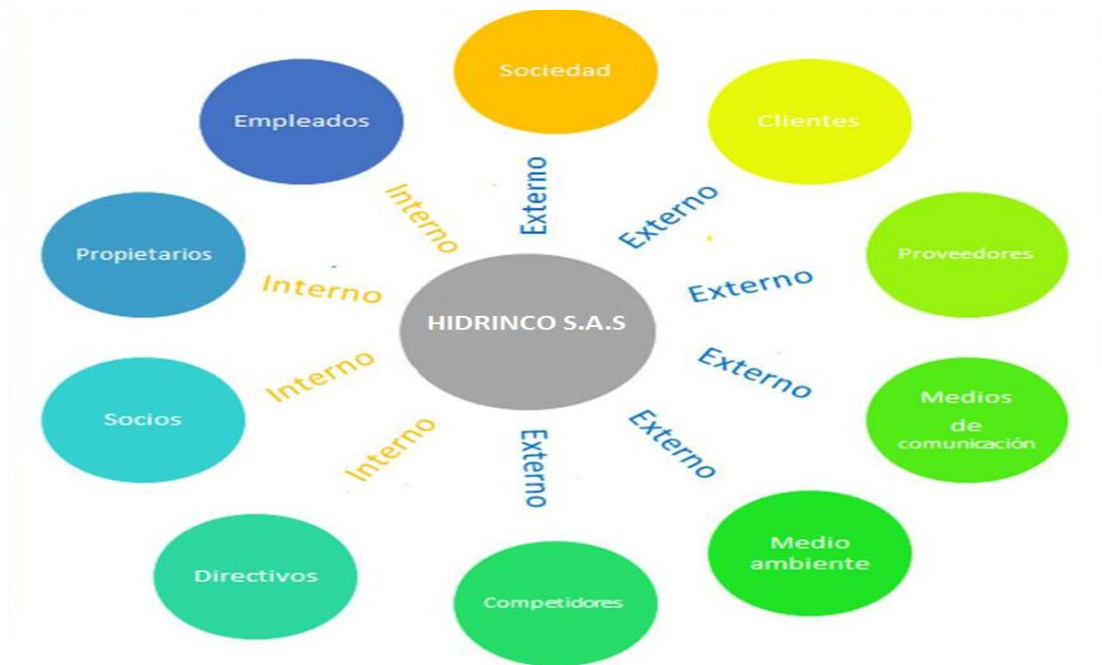
Ilustración 3. Stakeholders Jeimmy Veronica Santos