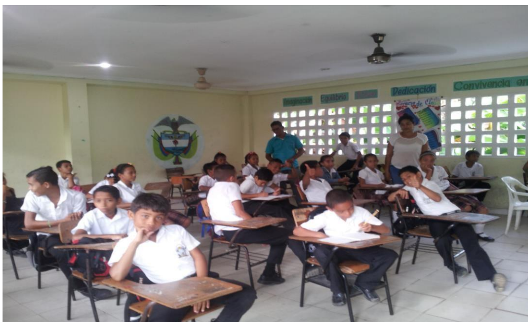
Compartiendo con los Estudiantes de Quinto Grado.