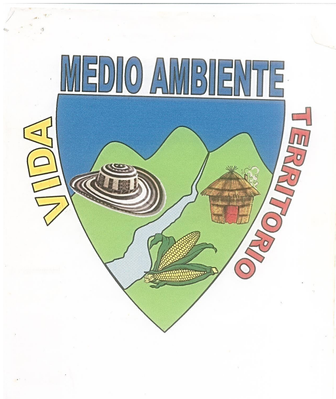
Escudo comunidad Indígena Zenu, del municipio de Valencia –Córdoba