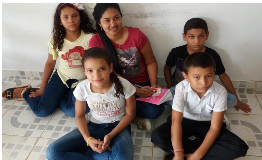
Dialogo con los Niños y Niñas de Quinto Grado.