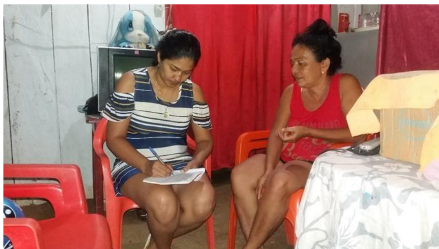
Entrevista a una representante de la comunidad Zenu.

Evidencias de contacto con la comunidad.