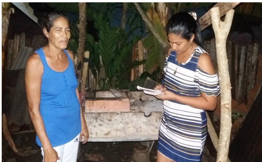
Entrevista a una integrante de la comunidad Zenú