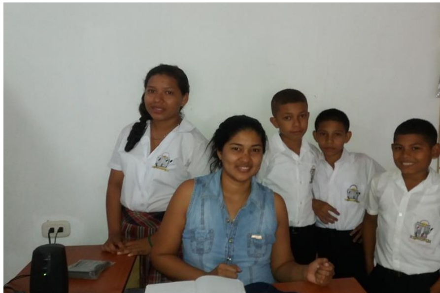
Contacto con los Estudiantes de Quinto grado.