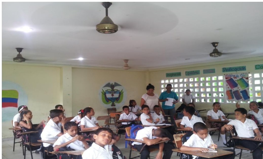
Compartiendo con los Estudiantes de Quinto Grado en su espacio de construcción de conocimientos.