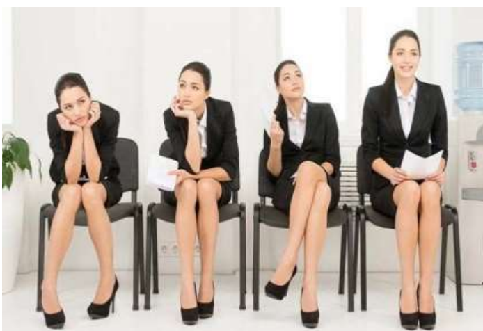
Figura 13. Comunicaciones movimientos corporales

Además, con ayuda de la marimba (instrumento musical de la región) realizaron movimientos del cuerpo dando a conocer mensajes directos de nuestra cultura Afrobarbacoana.