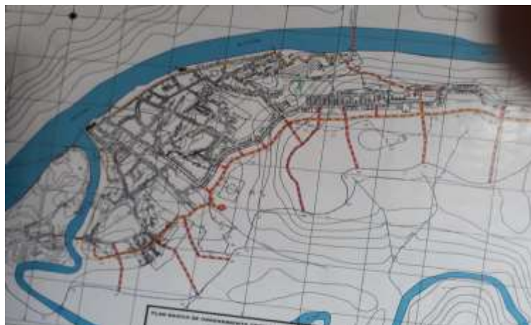
Figura: 5 croquis Cabecera Municipal

Superficie. El municipio de barbacoas tiene 3.427 kilómetros cuadrados de superficie.