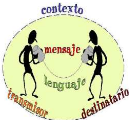
Figura: 12 la comunicación

posteriormente procedimos a sintetizar un concepto claro de lenguaje plasmado en una cátedra, la cual fue ubicada en el salón de clase.