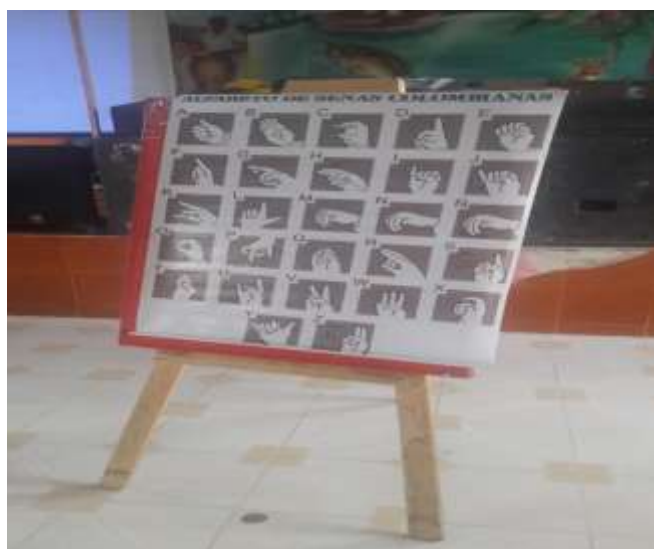
Figura: 15 comunicaciones por medio de señas

El proceso metodológico en la enseñanza de las manifestaciones artísticas regionales y locales, iniciamos con una serie de cantos regionales, los cuales fueron armonizados con marimba y otros instrumentos propios de la región en donde los niños participaron armónicamente, bailando y cantando. Después realizamos un comentario de lo ocurrido cada uno dio su opinión personal acertando sobre el tema tratado.