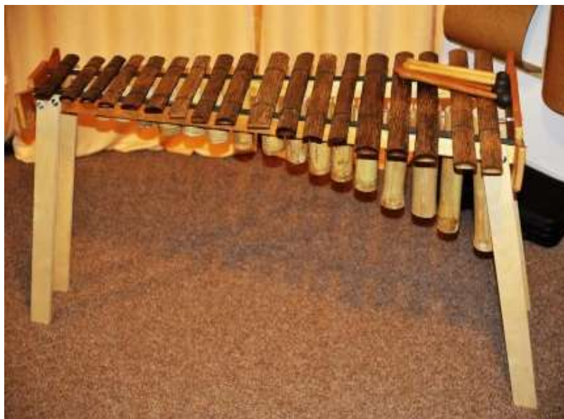
Figura 1. La Marimba

piano, los tambores en la mitad y las cantaoras adelante. Ahora ellas no escuchan la marimba, que debe estar al lado, porque es la que le da el tonito a la voz, las señoras cantan y el marimbero va buscando la tabla hasta que llega al tono. Con la marimba temperada uno da el tono y dice: vamos a cantar por DO o por RE el día que uno le diga eso a don Silvino lo insulta. El maestro Gualajo, que hay que tocar por DOS noes por DO.