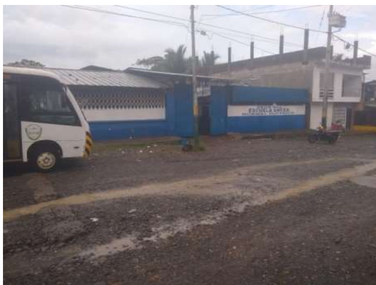
Figura 8: escuela anexa sede # 2

Al lado de ella está ubicada la carretera principal del municipio donde transita constantemente de vehículos de todo tipo; como carros, motos, bicicletas.