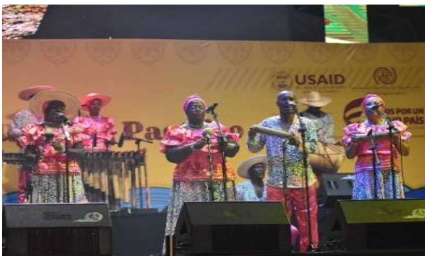
Figura 20 expresión cultural