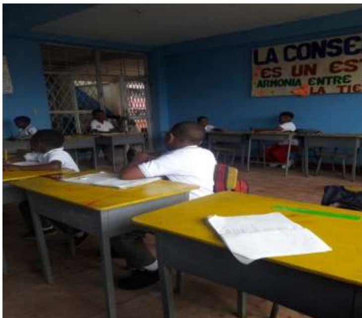
Figura 7: niño Jesús de Praga sede # 4

La sede cuenta con trecientos sesenta y siete estudiantes actualmente, los cuales están distribuidos desde el grado preescolar hasta el grado quinto de Educación primaria