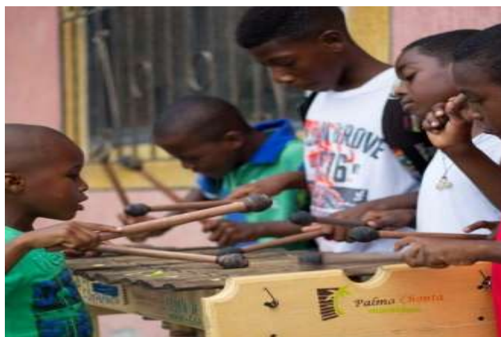
Figura 10. Estudiantes en la práctica artística pedagógica

El lenguaje no verbal o de gestos aporta a la comunicación una serie de matices que tienen más importancia de la que creemos, ya que no todo lo que decimos lo decimos con palabras. Sin darnos cuenta, nuestro cuerpo transmite información sobre nuestras emociones y personalidad. Incluso estando en silencio nuestra postura expresiones faciales y apariencias hablan por nosotros.