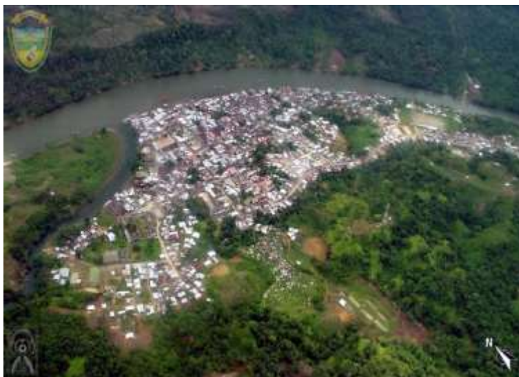
Figura 4. Cabecera Municipal