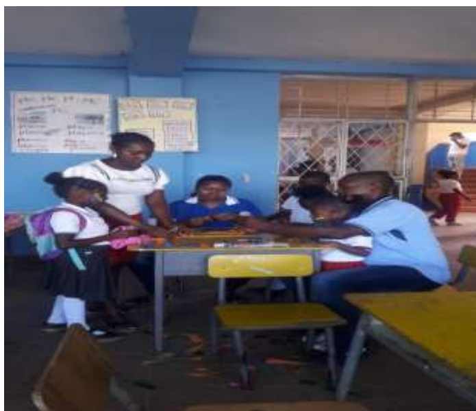
Figura 17. Realizando Avisos publicitarios