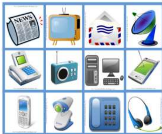
Figura 18 medios de comunicación

Posteriormente realizaron carteles con diferentes tipos de información; por lo tanto en un debate cada grupo dio a conocer su trabajo sobre medios de comunicación