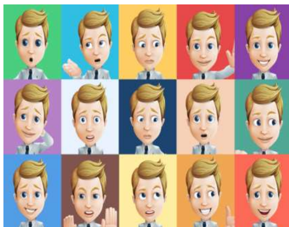
Figuran 14 comunicaciones a través de gestos

El proceso metodológico en la enseñanza de las manifestaciones artísticas regionales y locales, iniciamos con una serie de cantos regionales, los cuales fueron armonizados con marimba y otros instrumentos propios de la región en donde los niños participaron armónicamente, bailando y cantando. Después realizamos un comentario de lo ocurrido cada uno dio su opinión personal acertando sobre el tema tratado.