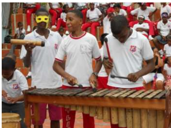
Figura 9. Muestra artística.

Se utilizó el método de investigación acción participativa en el sentido de aportar al proceso educativo que se encamina al propósito o misión institucional lo cual va a permitir que los niños y niñas se formen integralmente permitiendo un desarrollo integral para facilitar la convivencia escolar.