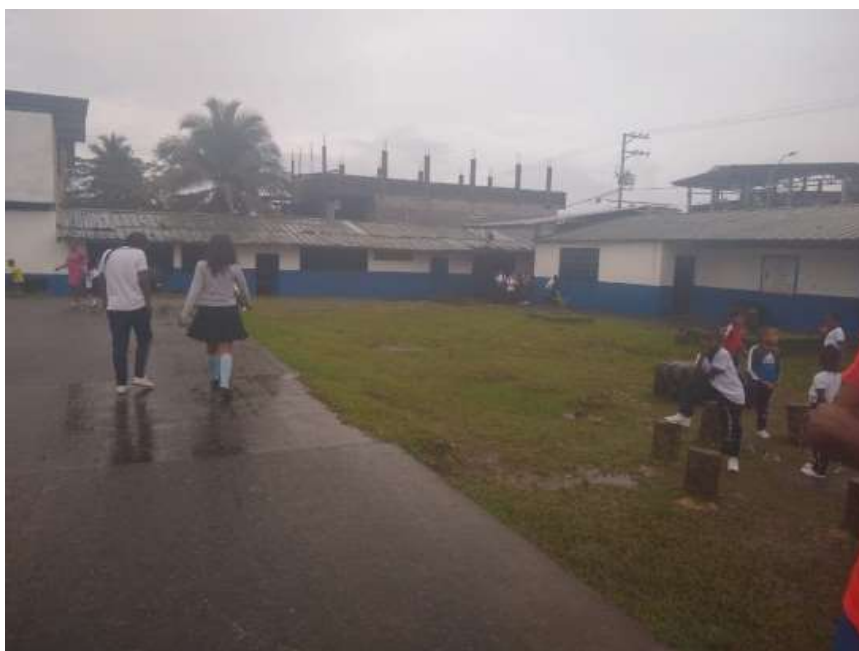
Figura A: escuela anexa Normal Superior sede N°2