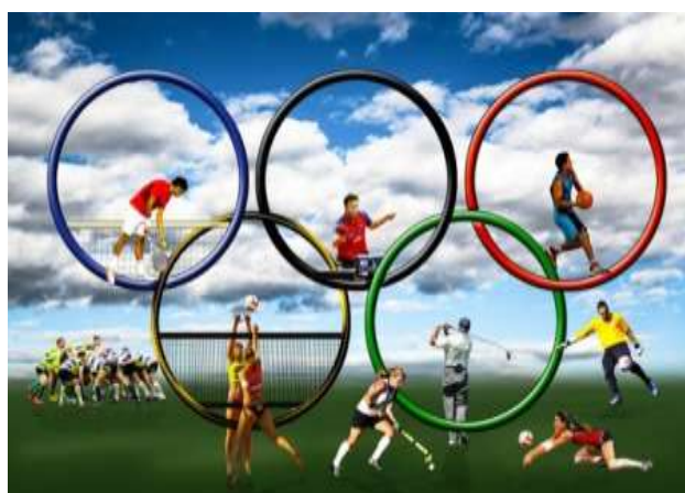
Figura: 19 deporte