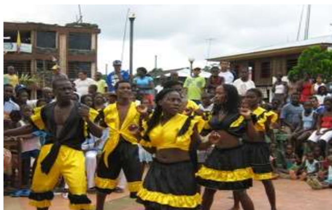
Figura 16. Baile de marimba

En la comprensión de textos, se realizaron lecturas de agrado para el niño o niña, donde ellos con ayuda de imágenes lograban explicar el contenido de ellas, a nivel individual y grupal. Aquí elaboraron de forma grupal carteleras de carácter informativo.