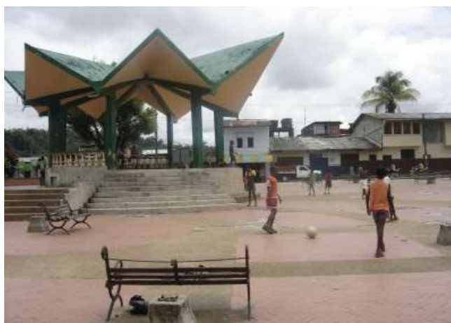
Figura 6. parque Tomas Cipriano de Historia de Barbacoas

Organización social: si volteamos la historia en Barbacoas en relación con los primeros pobladores de la región, de la región, nos damos cuenta que está habitada por indígenas y estos a su vez se encontraban organizados en tribus. Con la llegada de los españoles y los negros traídos como esclavos y hasta la presente organización social es por familias. Estas familias se han distribuidos en lo rural como en lo urbano formando los diferentes caseríos y barrios como (San Antonio, Guayabal, Peña Liza, Paso Grande, la Loma, calle del Comercio, el Paraíso, el Ecuador, la Unión Quilindé, el Bajito, calle Nueva Granada, Loma del Pampón, Loma las Mercedes, la primavera, calle Barragán, calle el Guabo, calle el Cuerno, calle Acequia Arriba, las Delicias, etc.