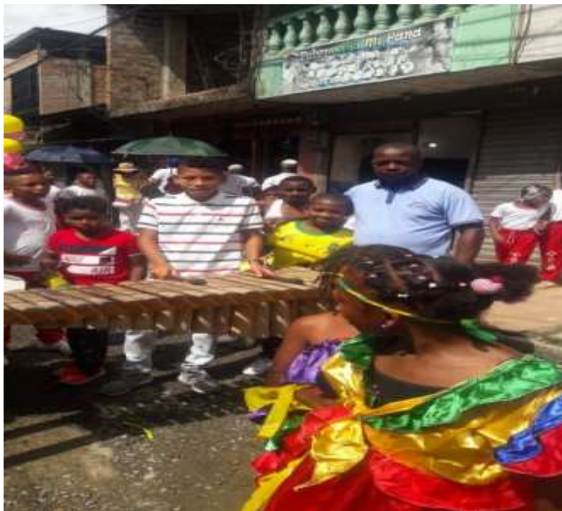
Figura B: eventos de toques de marimba