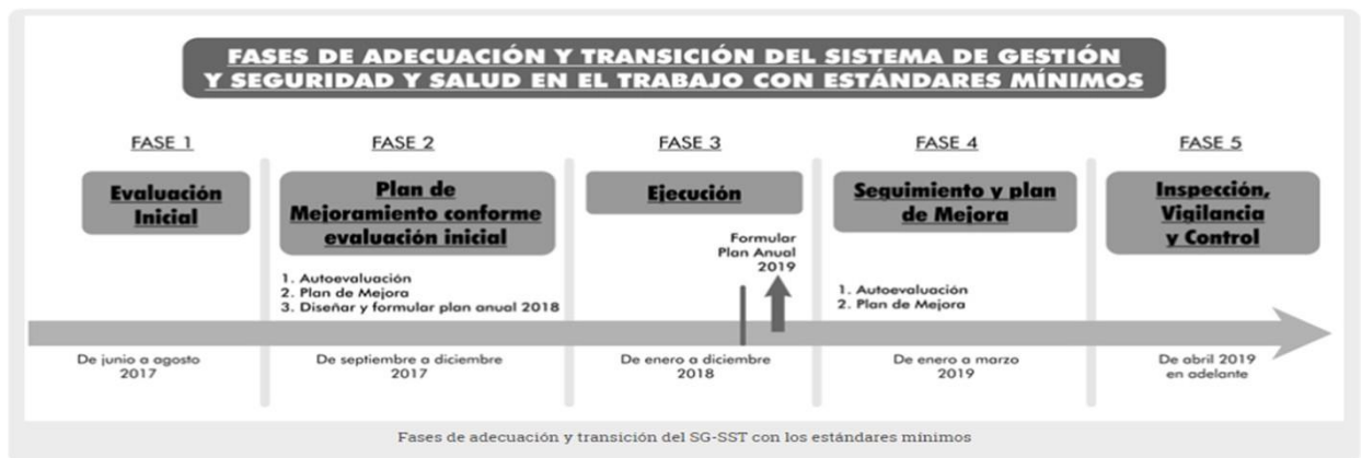
Ilustración 1. Fases de adecuación y transición del (SG-SST).