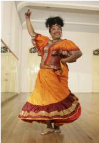
Ilustración 30: Toto La Momposina

Toto La Momposina: -“En realidad soy considerada 'cantadora', una intérprete musical que cultiva la cultura tradicional de un pueblo, y esto constituye “un título que lleva la responsabilidad social más allá de alguien que canta canciones, ya que se transforma en una verdadera matriarca de la comunidad” (...). Para mí es motivo de orgullo ser invitada al Festival Artístico Invasión De Cultura Popular FAICP ya que este presenta a la comunidad una variedad muy amplia de todas las manifestaciones artísticas, culturales y musicales. Llevando y dando a conocer la cultura nacional y además internacional a personas que no tiene acceso a este tipo de eventos, así que esta es una de las razones por la que me gusta este festival” (Alvarado, 2016, p.15)