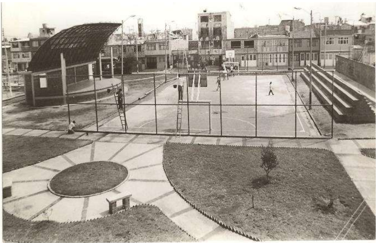
Ilustración 19: Parques de las Artes Tchyminigagua terminado (al fondo se ve la sede principal)