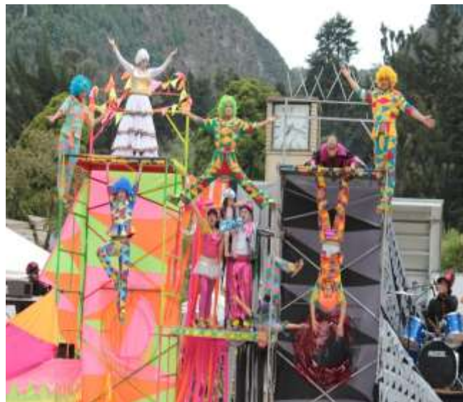
Ilustración 13: Representación obra Sueños Encantados