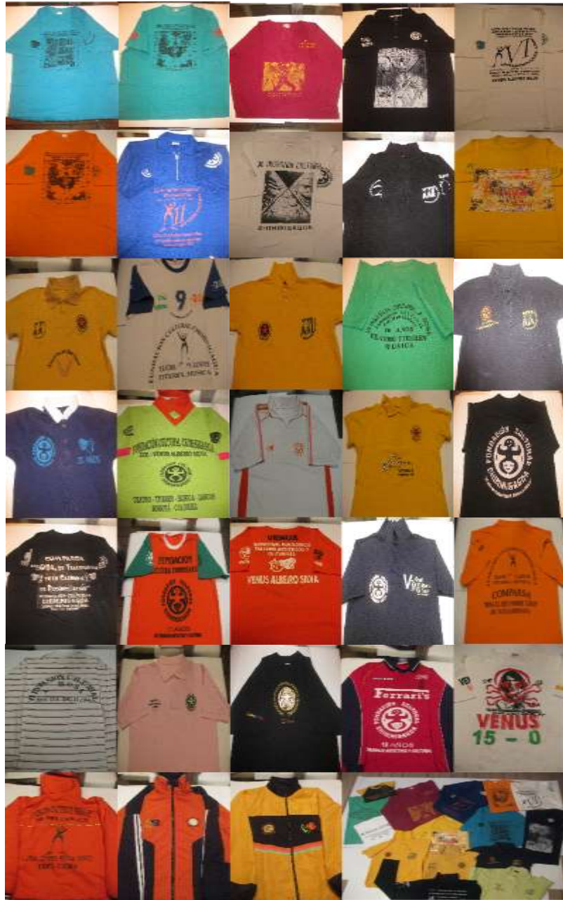
Ilustración 17: Recuento de las sudaderas que han utilizado como uniforme los Tchymis (inicialmente fueron usadas para evitar el seguimiento policial)