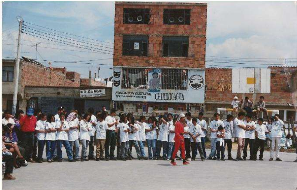
Ilustración 8: Sede Laureles en construcción