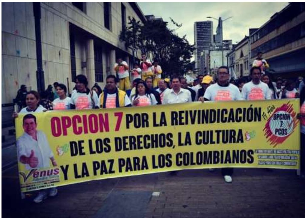
Ilustración 18: Partido Comunitario Opción Siete marchando el 1 de mayo 2016.

social, que abarca, además de las artes y las letras, los modos de vida, las costumbres, las maneras de vivir juntos, el sentido de pertenencia los sistemas de valores, las tradiciones y las creencias; quienes han promovido la no violencia, la tolerancia, la honestidad, la organización comunitaria, la solidaridad, la participación ciudadana y política; donde la comunidad, los barrios populares del sur de Bogotá, son su razón de ser (Silva, 2016).