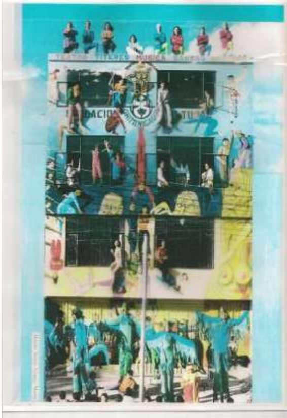
Ilustración 9: Sede Laureles terminada