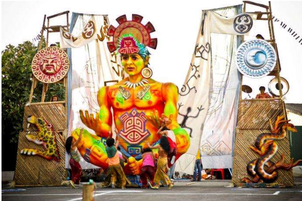
Ilustración 5: Creación del maestro Otero en honor a Tchyminigagua (dios de la creación)

Otro proceso que se lleva a cabo de transformación social, reivindicación y recuperación de lo ancestral, es el que lleva a cabo la Fundación Tchyminigagua en Bosa, grupo de teatro que lleva 31 años trabajando para llevar el arte a los sectores marginados en toda la ciudad de Bogotá de forma gratuita. Este proyecto fue el seleccionado para ser abordado en la investigación.