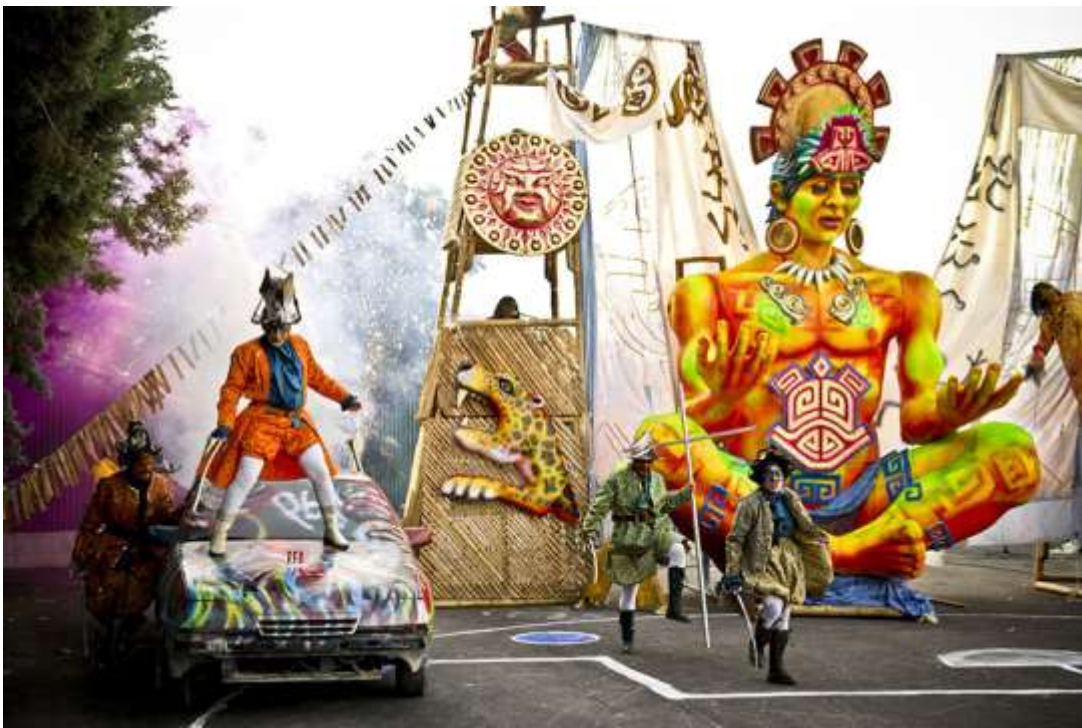
Ilustración 14: Representación obra Trilogía Muisca

Chibchas, estrenada en el X Festival Iberoamericano de teatro Bogotá, en esta obra teatral se representan los mitos tradicionales de la cultura muisca, con un gran contenido teatral, desde una visión para calle, soporte de las historias más importantes de la cultura muisca, con música en vivo representativa de Latinoamérica, se han realizado más de 100 funciones con gran éxito para un arte teatral en Colombia y Europa.