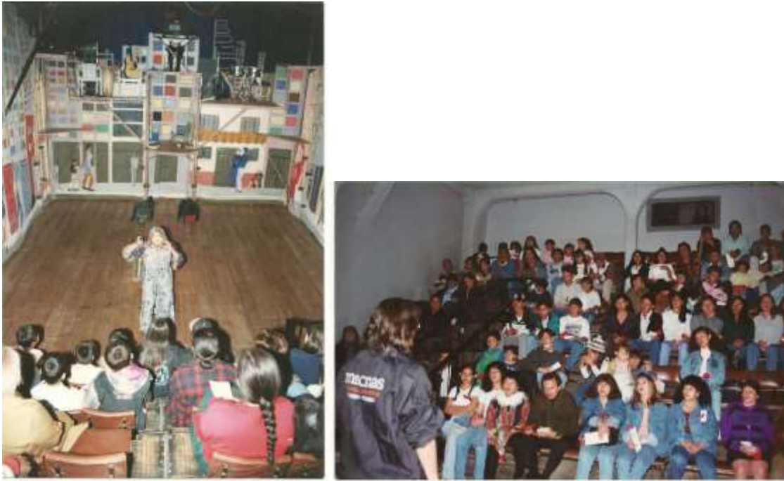
Ilustración 12: Primer sala teatral del sur en la sede de Bosa Laureles.

Un balance de los proyectos sobresalientes que ha desarrollado la Fundación Tchyminigagua durante estos 31 años, que se evidencian en las revistas Hojas al Aire (de las ediciones 2003, 2005, 2012, 2015 y 2016), son: