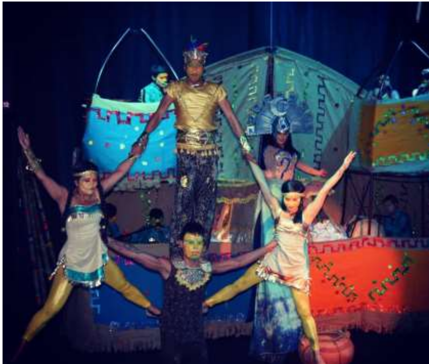
Ilustración 15: Representación de la obra Guatavita