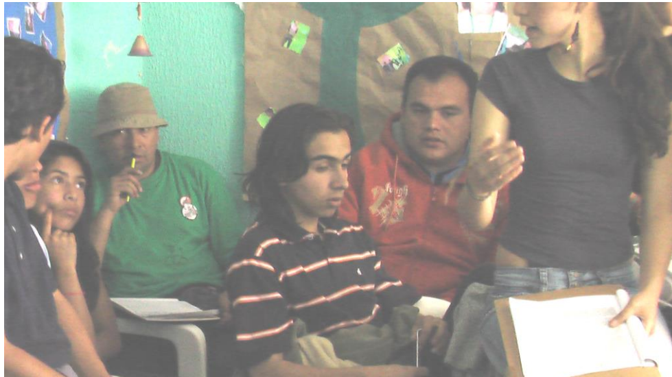
Figura No 7. Sesiones de formación y empalme entre CODEC y los jóvenes que fundarían “Videos y Rollos”.