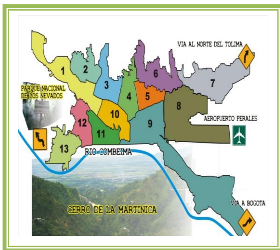
Figura 1. Mapa De Ibagué Con Las Comunas