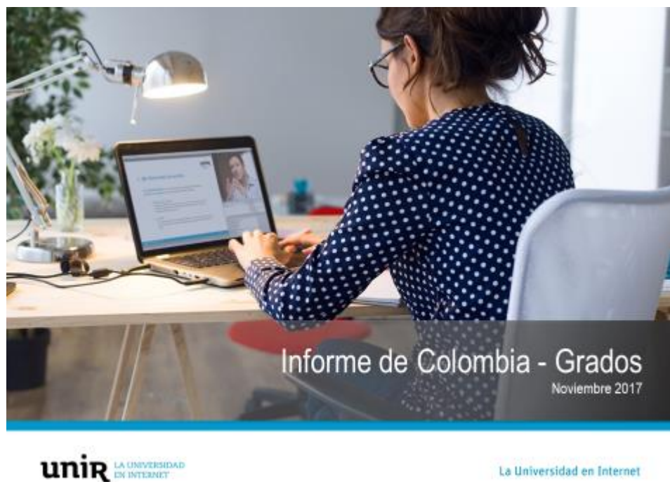
Figura 1. Portada de presentación sobre el informe de grados en Colombia.

Después de terminar satisfactoriamente el segundo ciclo, se comienza el tercer y último ciclo propuesto comenzando desde el 2 de Noviembre hasta el día 12 de diciembre donde se repite el proceso realizado en los dos primeros ciclos pero con unos diplomados solicitados por la UNIR.