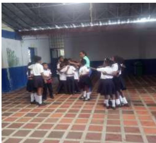
Figura 7. Conformación de grupos

Después de narrar los versos les enseñamos que un verso está formado por una estrofa y que se compone de cuatro renglones y la unión de estos versos forma el arrullo dando como resultado pedagógico alcanzado la interpretación de los versos narrados y de las imágenes presentadas por partes de los estudiantes.