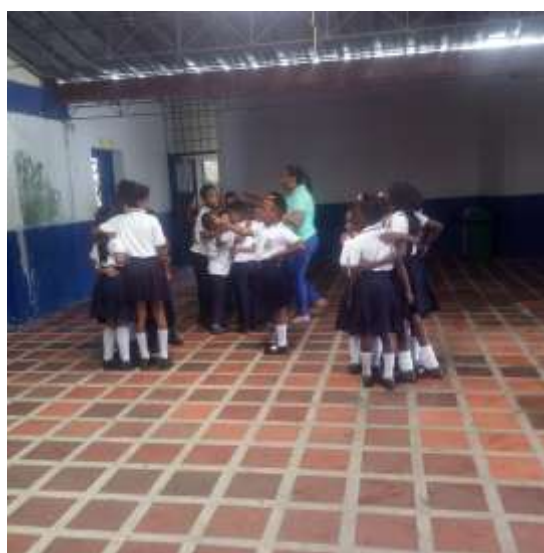
Unión de versos para conformar el arrullo