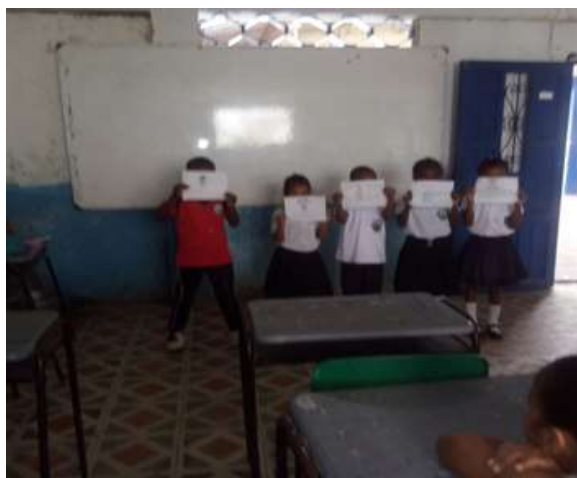
Figura 8. Elaboración de dibujos

También se debe Orientar el establecimiento sobre las condiciones educativas que permitan los cambios requeridos en los ambientes de participación y organización de los materiales, espacios físicos, tiempos y equipos adecuados y necesarios para el mejoramiento cualitativo de la las practicas orales tradicionales.