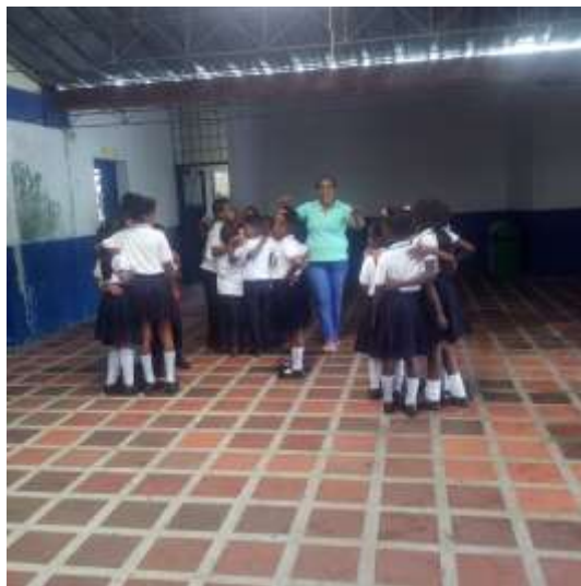
Grupos narración versos