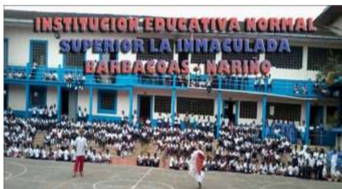
Figura 2. Institución Educativa La Inmaculada