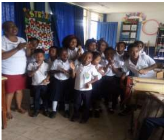
Figura 4. Estudiantes en el aula de clase