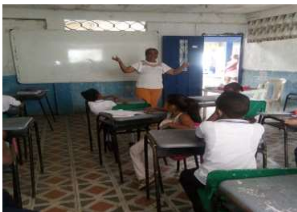
Figura 3. Clases en la Institución Educativa la Inmaculada

La Escuela Normal proyecta sus actividades lúdico-pedagógicas hacia la comunidad en general fortaleciendo todos los componentes del ámbito contextual.