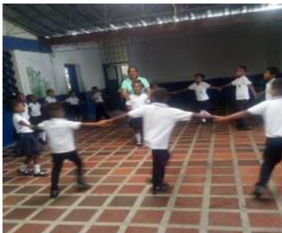
Figura 3. Rondas en la Institución Educativa La Inmaculada

Es una herramienta o técnica aplicada al proceso de recolección investigativo en el cual consiste en la indagación de las actitudes de los sujetos objetos de estudios con relación al abordaje de una o diversas situación problemáticas sociales a indagar.