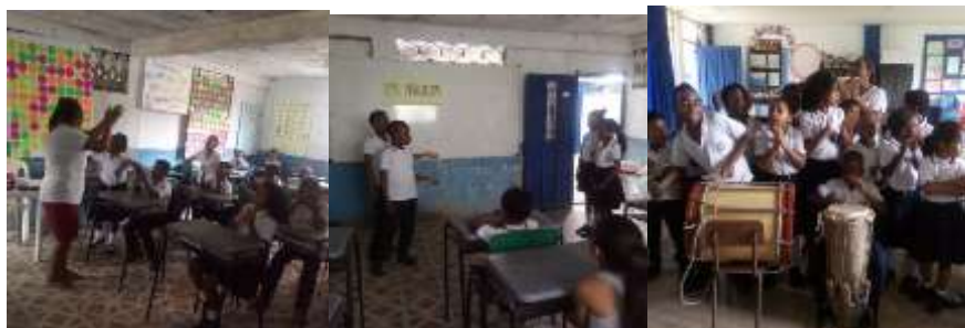
Figura 5. Recursos para la enseñanza de los arrullos