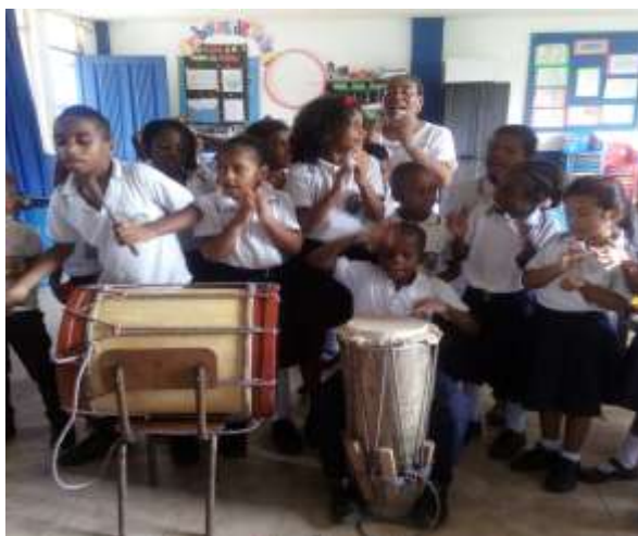
Figura 6. Entonación de arrullo

Aquí en esta tiradera los niños se dan cuenta que los versos tienen que rimar el primero con el tercero y el segundo con el cuarto para formar los arrullos. Dando como resultado pedagógico alcanzado el reconocimiento de la rima o ritmo de los saberes en los versos y los arrullos.