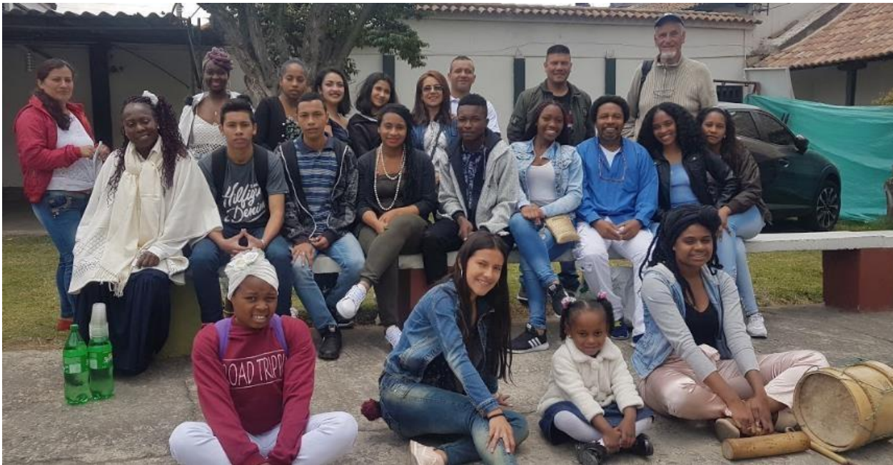
Ilustración 4 Espacio Pastoral Afro.

Se manifiesta por los y las integrantes la estrategia Kandombeando - Rescatando la identidad afrocolombiana en medio de la interculturalidad es una propuesta en pro de minimizar la pérdida de saberes ancestrales e identidad afro en un contexto como Bogotá, en donde llegan diferentes poblaciones y cada una debe sobrevivir en un ambiente diferente lejos de su territorio de origen, en donde se hacen adaptaciones de alimentación, vestimenta, símbolos e historias familiares.