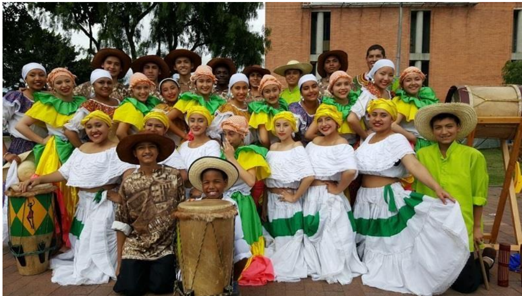
Ilustración 2 Integrantes corfolkanyc infantil y juvenil

zona centro sur del pacifico a población afro y mestiza en espacios como talleres, conversatorios, tertulias que convergen en la escuela de formación gestando reflexiones pedagógicas que permiten de manera critica aprender y desaprender.