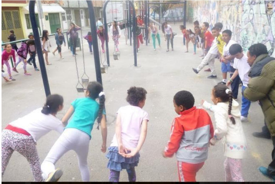
Ilustración 3 Acciones grupo infantil grupo inicial.