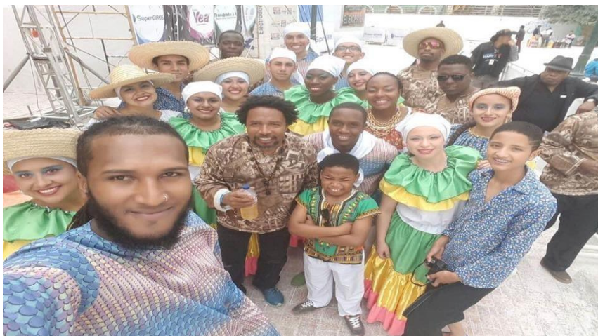
Ilustración 7 Carnaval de Negros y Blancos – Pasto (Nariño) 2017