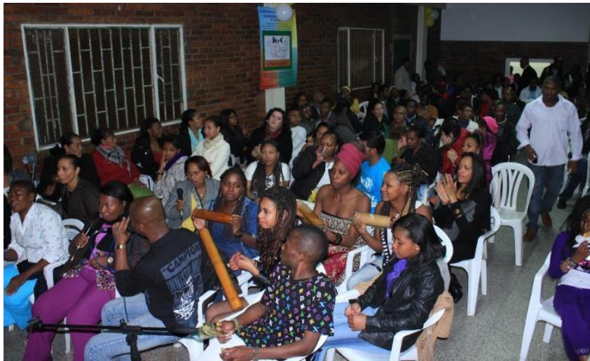
Ilustración 5 Velorio Santoral Virgen de Atocha. Gestión y Organización Corfolkanyc.

Para referir gestión cultural Corfolkanyc , exalta la necesidad de regresar en el tiempo y organizar una secuencia dada la importancia de los hallazgos encontrados en la investigación, cada generación aporta para continuar con su enfoque filosófico rescatar mantener y proyectar.