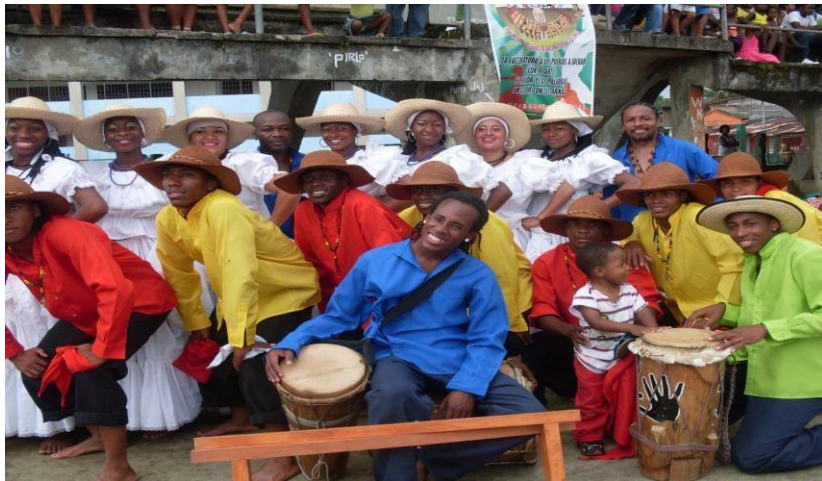
Ilustración 6 Festival intercultural Barbacoas (Nariño)

Teniendo en cuenta la cronología anterior, aunque la investigación se centró a partir de las acciones desde el (2003), por la relevancia en la interlocución con espacios locales como Consejos locales de planeación, cultural, juventud y afro, además del comité local de etnias e instituciones en donde las acciones en pro de la gestión cultural se precisan frente a la asesoría de proyectos locales e interlocales, convocatorias distritales y diálogo directo con líderes a nivel nacional especialmente la zona pacífica sur por los municipios costeros.