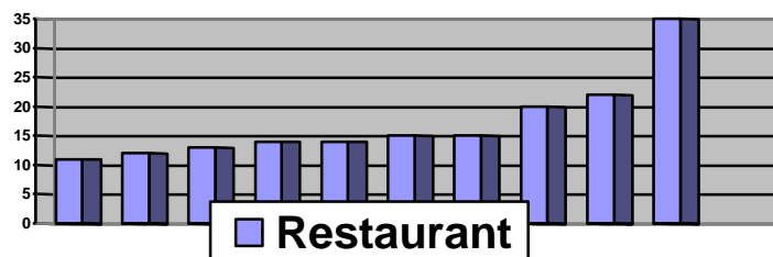
Grafico 1. Comportamiento Higiénico Sanitario De Los Restaurantes A Orilla De La Carretera Vía Al Mar.

Una vez conociendo los resultados de los 10 restaurantes se observa que ninguno obtuvo porcentajes que alcanzaran por lo menos la mitad del 100% del perfil sanitario realizados a cada uno, es decir a los 171 puntos, solo se alcanzo a 35 puntos como puntaje máximo un puntaje equivalentes a un porcentaje a un 20 % con una calificación DEFICIENTE. Ver Tabla 2 - Ver Grafico 1 a.