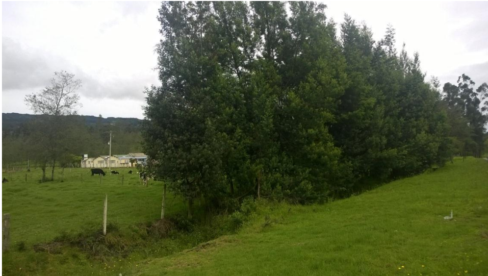
Figura 3. Acacia decurrens utilizada como cerca viva (Chiquinquirá, Boyacá)