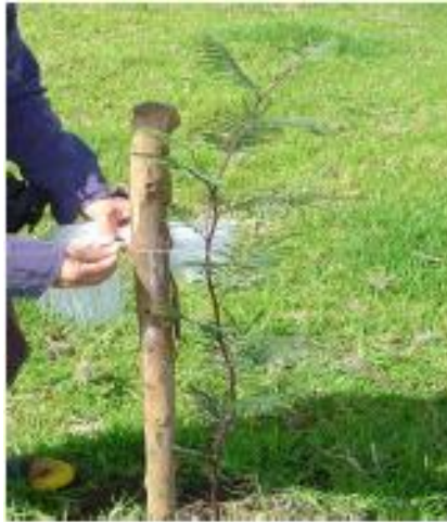
Figura 5. Árbol de A. decurrens amarrado a tutor.