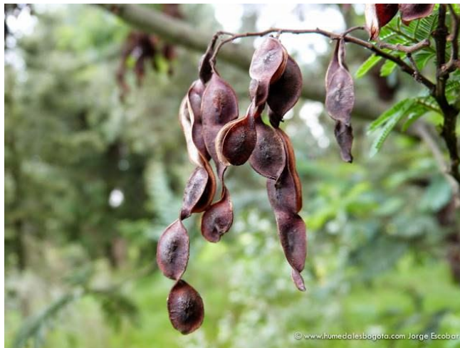
Figura 2. Vainas de A. decurrens