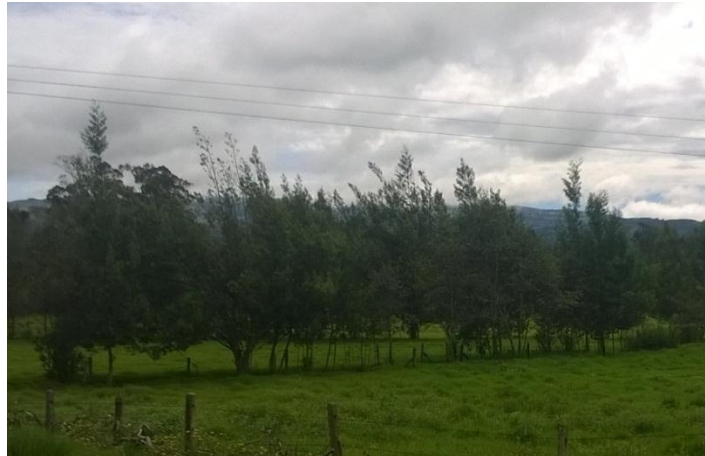
Figura 6. Acacia decurrens usada en silvopastoreo (Chiquinquirá, Boyacá)