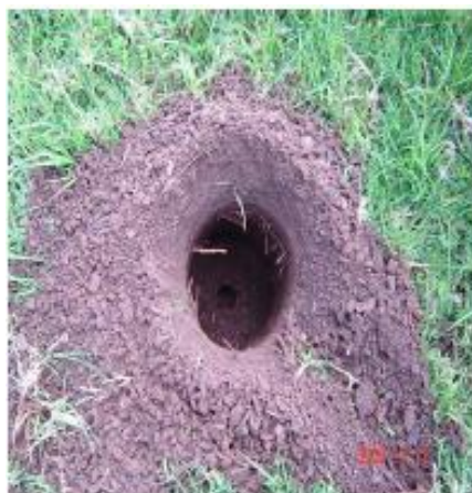
Figura 4. Siembra de árboles de A. decurrens en huecos realizados con broca hidráulica.