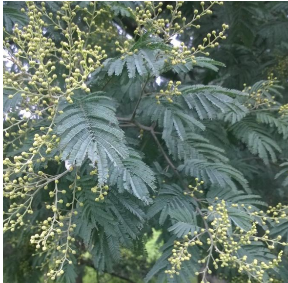
Figura 1. Hojas de Acacia decurrens con inflorescencias.