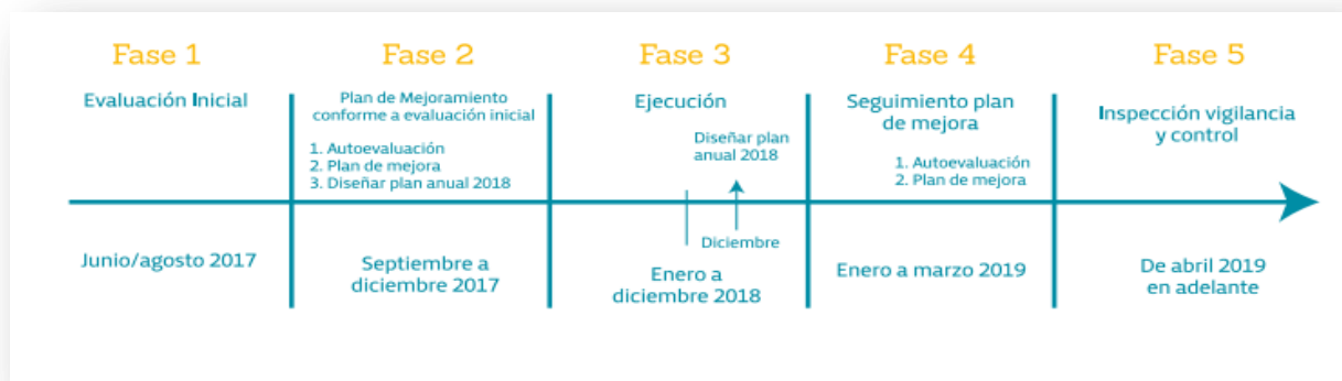
Ilustración 1/Figura 1: Etapas para el desarrollo del SG-SST

Las fases de adecuación, transición y aplicación del SG-SST son: