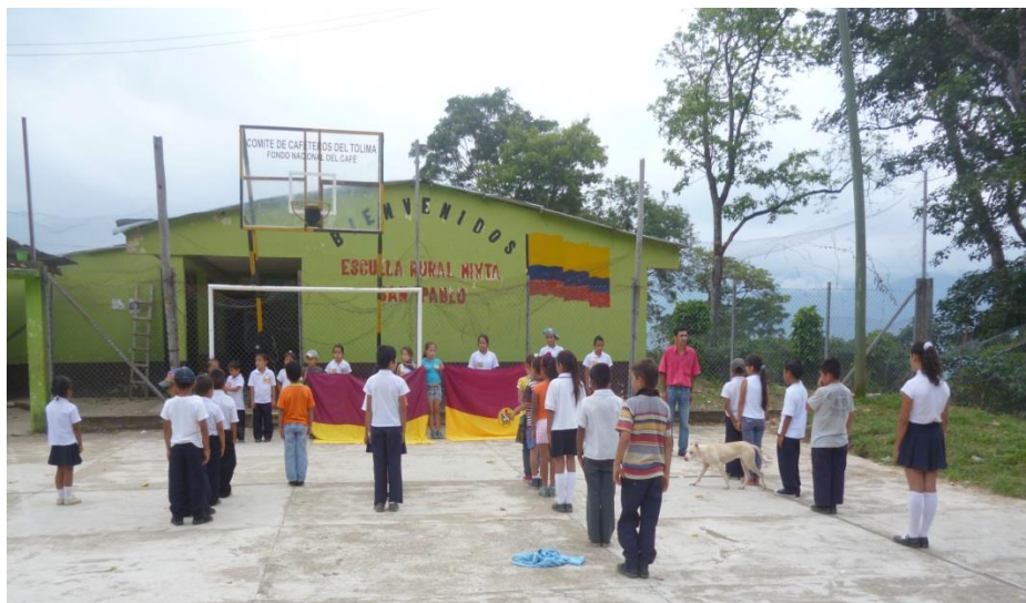
Ilustración 10 Formación estudiantes de la vereda San Pablo 2014