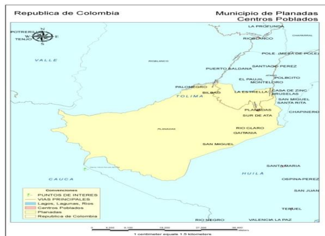
Ilustración 1 Mapa de Planadas