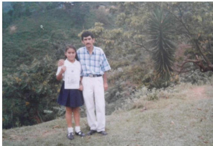
Ilustración 8 Estudiante graduada del grado quinto de primaria, escuela La Guajira 2001