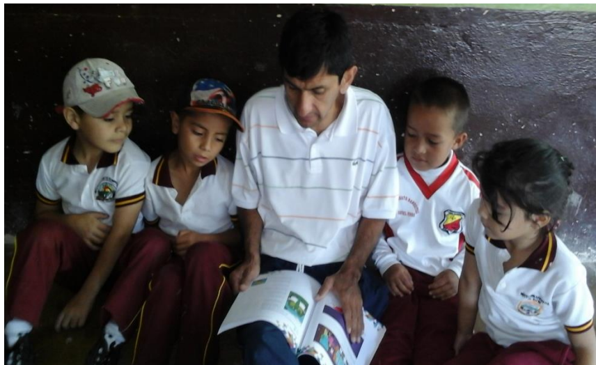
Ilustración 14 Niños de grado segundo en clase de Español, escuela San Pablo 2017