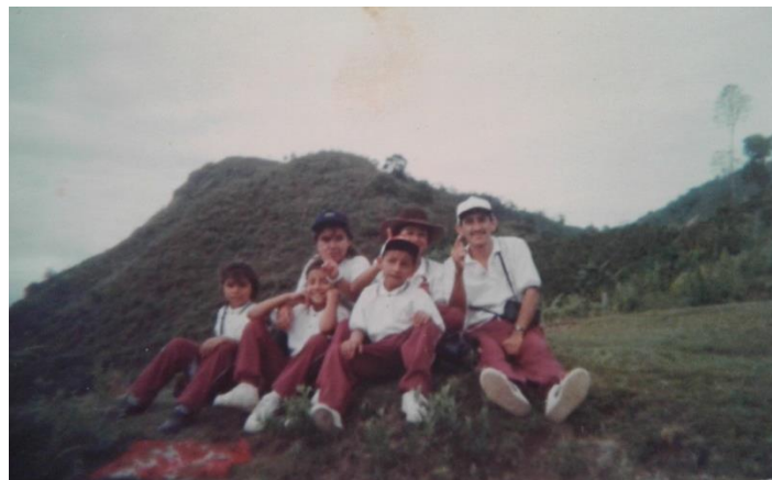
Ilustración 6 Estudiantes salida de campo, quinto de primaria en la escuela La Guajira 1997