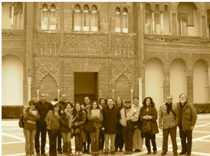
Visita al Alcázar de Sevilla, 2005. Promoción 2004-2006.