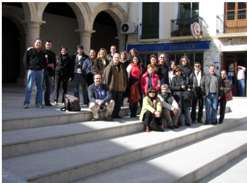
Visita a Loja, (Granada) 2007. Promoción 2006-2008.

En cuanto a la parte práctica de la asignatura, se desarrollaba: