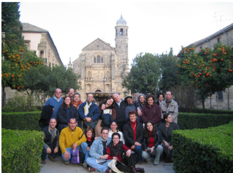
Visita a Úbeda (Jaén) en 2004. Promoción 2002-2004.