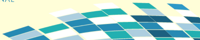
Tabla 7: Implicación intercultural y relaciones con otras culturas