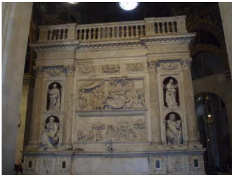
Fig. 6. Vista de la Santa Casa desde su exterior

lauretano 53 . De regreso en España, Espínola prosiguió una brillante carrera religiosa, que le llevó a ser designado arzobispo de Granada en 1626 y de Santiago de Compostela en 1630. Con esta última responsabilidad viajó de nuevo a Roma en noviembre de 1630, permaneciendo allí hasta 1635. En 1631, estando por tanto en Roma, el cardenal envió a la Santa Casa una cadena con una cruz de oro esmaltada en una de sus caras y cuajada de diamantes en la otra, valorada en mil escudos de oro. El presente fue entregado al santuario por el padre Tiberio Cenci 54 , tal vez como gesto de gratitud a la Virgen por haber obtenido el título de San Bartolomeo all'Isola en marzo de ese mismo año. Vuelto a España una vez más, el cardenal fue llamado por Felipe IV a la corte en 1637 para ejercer de consejero. Residió en su sede de Compostela a partir de 1643, hasta que fue transferido al arzobispado de Sevilla en 1645, muriendo cuatro años más tarde en esa ciudad.