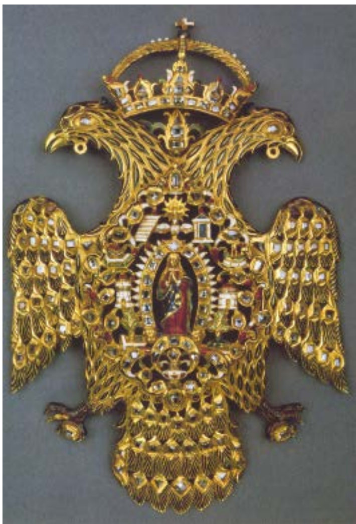
Fig. 5. Joyel en forma de águila bicéfala. Madrid, Museo Nacional de Artes Decorativas

Aunque las fuentes nada dicen al respecto, es muy probable que la infanta, siendo consciente de su edad, algo avanzada para una novia de la época, rogase en aquella ocasión a la Virgen que intercediera para la feliz