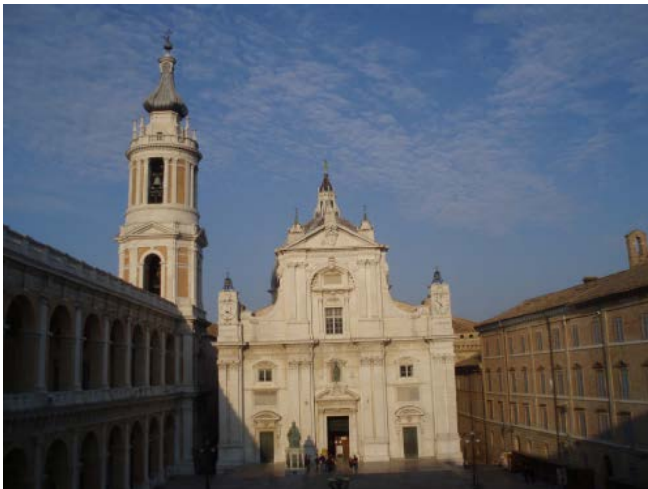
Fig. 1. Vista del Santuario de Loreto en la actualidad

colina propiedad de los condes Stefano y Simone Raineldi, quienes comenzaron de inmediato a disputarse su propiedad. Por ello se produjo un traslado definitivo, que llevaría el hogar de María a la cima de un monte próximo, contiguo al camino que conducía a Recanati, emplazamiento en el que siguió definitivamente y donde con posterioridad se levantó el santuario de Loreto (Fig. 1).