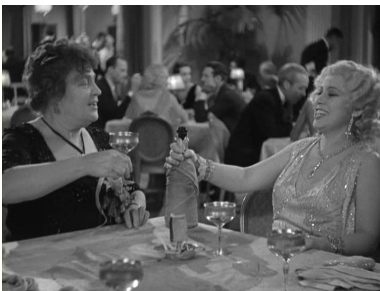
[FIGURA 1] Maudie y Miss Jellyman brindando

En las tres escenas en las que interviene Mae West los diálogos se cargan de doble sentido y sugerencias “procaces”. En el argumento principal el ex-boxeador que intenta redimirse está tomando clases de comportamiento social con la solterona Miss Mabel Jellyman (una mujer colocada en el estereotipo de la solterona institutriz interpretada por Alison Skipworth). En la primera escena, están cenando el ex-boxeador, Miss Jerry Healy (la heroína de la película) y Miss Jellyman, cuando llega Maudie, una amiga “de la noche” del ex-boxeador. Lo primero que ocurre es que Maudie emborracha a Miss Jellyman, que termina hablando de amor “a primera vista”, sin que quede claro si se refiere a su alumno, el ex-boxeador, o la recién llegada (y escandalosa, entra en escena a los gritos) Maudie. Miss Jellyman y Maudie quedan solas cuando la pareja protagónica se retira, bebiendo y con Miss Jellyman hablando de deshacer sus inhibiciones y su vida de 27 años de tristeza .