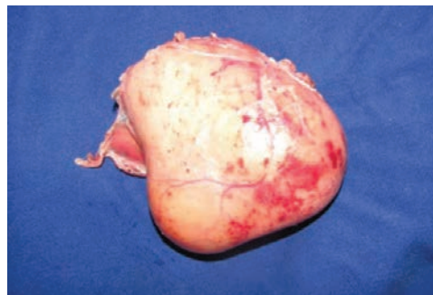
Figura 2. Lesión reseca