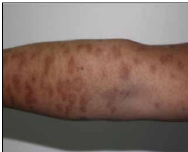
Figura 4. Placas pardo eritematosas redondeadas.