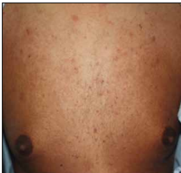
Figura 3. Múltiples pústulas de base eritematosa.