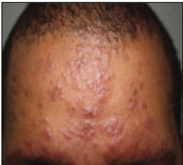
Figura 2. Pápulas y placas pardo eritematovioláceas infiltradas.