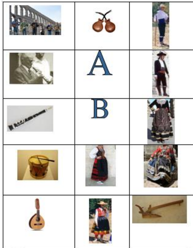
Anexo 13: Tabla control numerada.