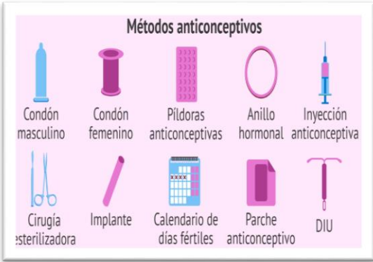
Imagen de algunos anticonceptivos masculinos y femeninos.