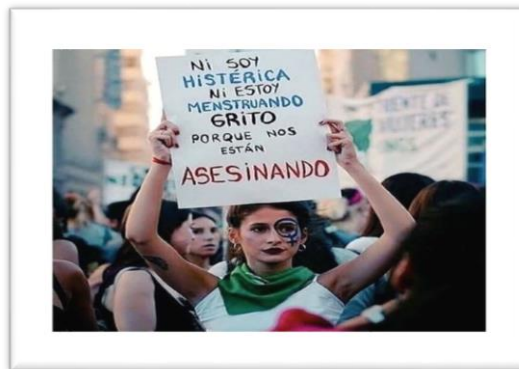
Imagen de una mujer en manifestación, presentada para discusión sobre el feminismo.