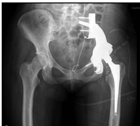
Figura 3. Control radiográfico postquirúrgico donde se visualiza la prótesis custom-made con sus anclajes en sacro y ramas pélvicas y el componente femoral.

Actualmente, tras 12 meses de evolución, la paciente se encuentra sin dolor, siguiendo los controles clínicos y de imagen periódicos. Consigue una movilidad acti-