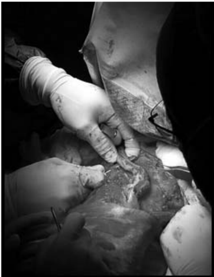
Figura 2. Osteotomía del tercio medial de la clavícula. Abordaje anterior.