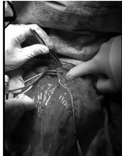
Figura 3. Ligadura de arteria y venas subclavas tras la osteotomía clavicular. Abordaje anterior.