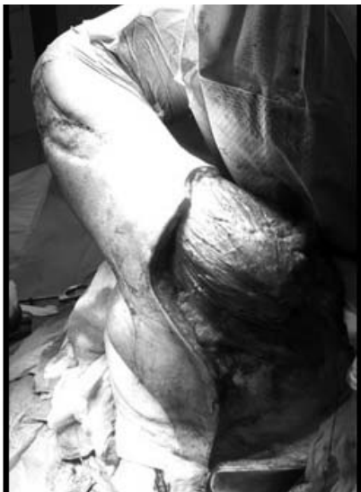
Figura 4. Abordaje posterior.