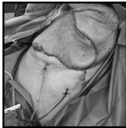
Figura 5. Cierre con colgajos simples de avance.