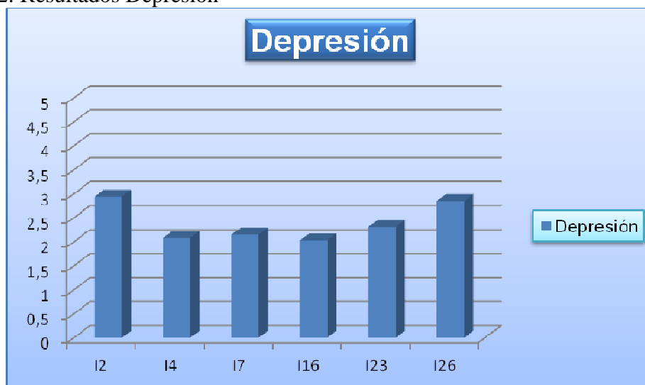
Ilustración 2: Resultados Depresión

Depresión : dimensión que se corresponde con los 6 ítems 2, 4, 7, 16, 23 y 26. La media de todos los ítems se sitúa en niveles bajos, por debajo del 3 de la escala likert, aunque los ítems con resultado más alto son 2 (“siento desánimo cuando pienso en el futuro”), 26 (“tengo que esforzarme muchísimo para hacer cualquier cosa”) y 23 (“siento tristeza o depresión”) situándose entre unas puntuaciones de 2 y 2.7. Por otro lado los resultados más negativos, en más desacuerdo, de esta dimensión son en los ítems 4 (“he perdido casi todo mi interés por los demás, apenas tengo sentimiento para ellos”), 7 (“suelo cambiar de humor bruscamente”) y 16 (“ahora lloro más de lo normal”) situándose entre 1.5 y 2.