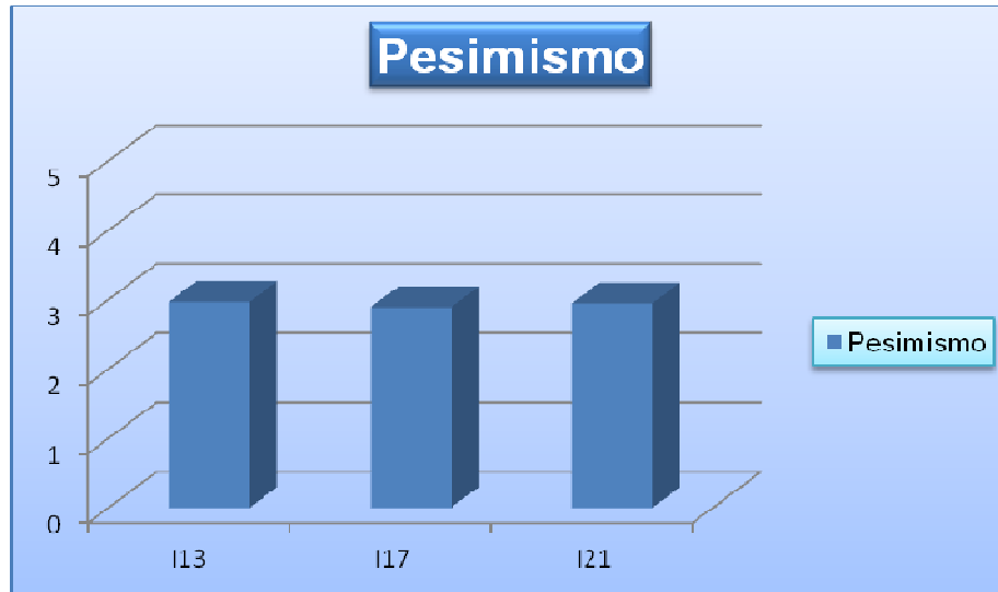
Ilustración 4: Resultados Pesimismo