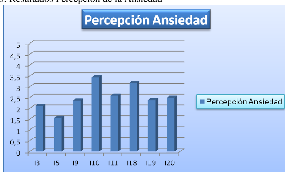
Ilustración 3: Resultados Percepción de la Ansiedad

Percepción de la ansiedad: concretada en los 8 ítems 3, 5, 9, 10, 11, 18, 19 y 20. Los resultados presentan una media elevada en los ítems 10 (“me cuesta concentrarme”) y 18 (“doy demasiadas vueltas a las cosas sin llegar a decidirme”) con puntuación superior a 3, el resto se sitúan por debajo de 2.5. En el sentido contrario, las puntuaciones más bajas, es decir, en desacuerdo, responden a los ítems 3 (“tengo palpitaciones, el corazón me late muy deprisa”) y 15 (“me muevo y hago cosas sin una finalidad concreta”) situándose ambos por debajo de 2.