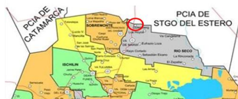
Figura 1: Mapa del NO de la Provincia de Córdoba, señalando la zona de estudio.