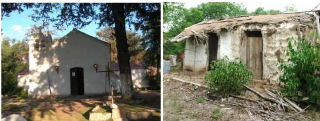
Figura 3- Ejemplos de obras relevadas

Luego del encuentro del equipo en una jornada de trabajo compartiendo todo el material producido, se concluyó con la elaboración de una ficha final, que ajustó con precisión cada una de las variables tecnológicas y socioculturales que se relevaron.