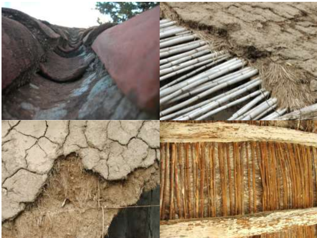
Figura 8- Muestras de materiales recogidos a analizar en el INTI (Instituto Nacional de Tecnología Industrial).